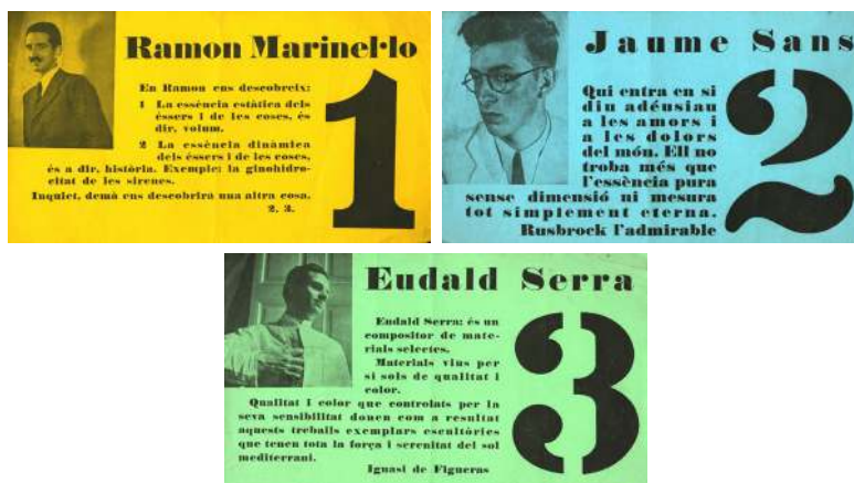
Figura 3A, B y C. Tarjetas de presentación de los artistas participantes en la exposición.