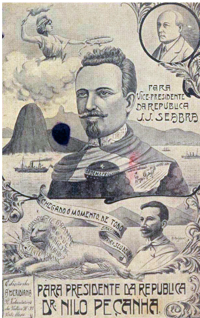
Figura 1 Cartão Postal que convocava os eleitores a votar nas eleições de 1922

“É chegado o momento de todo brasileiro cumprir o seu dever.” 58