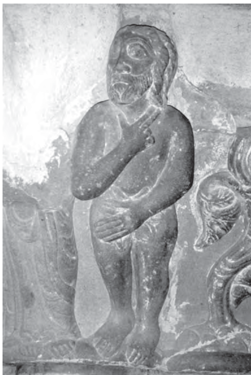
Figura 3 - San Juan de la Peña