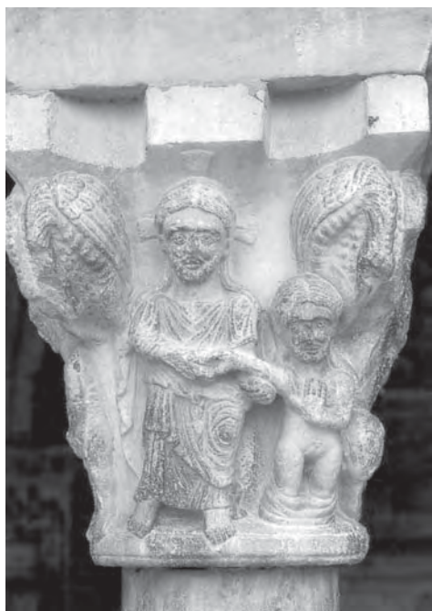
Figura 1 - Elme

tas e observado por milhões de pessoas, não era uma figura imutável, fixada pelos textos e pela tradição. Era a presentificação de um protótipo. Em Adão estavam contidos e prefigurados toda grandeza e toda fraqueza, todas virtudes e todos os vícios. Na sua trajetória da glória à perdição e novamente à glória, Adão sintetizava a história humana. Naquele momento em que renascia a autobiografia como gênero literário, a representação plástica de Adão e Eva, ao alcance de letrados e analfabetos, de homens e mulheres, de jovens e velhos, funcionava como uma autobiografia visual e coletiva do cristão medieval.