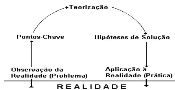
Figura 3 - Arco de Maguerez utilizado por Berbel, a partir de Bordenave e Pereira

A partir do conteúdo descrito na primeira parte do trabalho, pudemos constatar que: