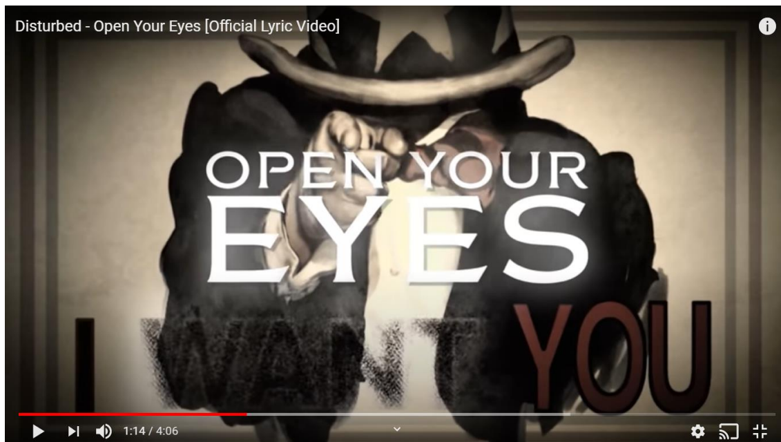
Figura 1: Referência ao icônico cartaz do Tio Sam reforça a incitação