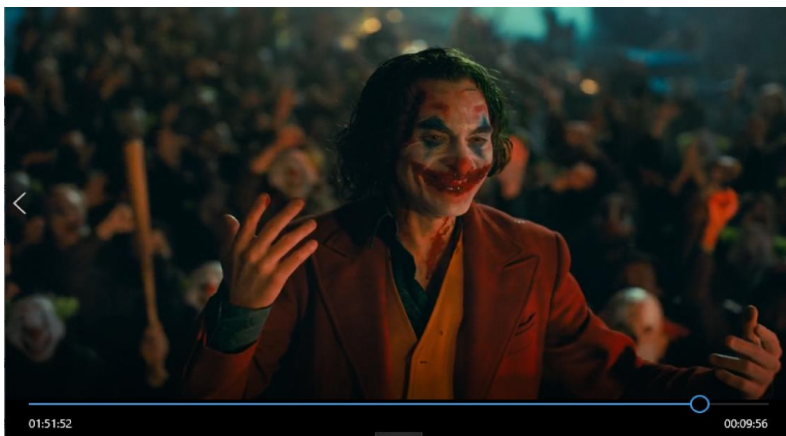
Figura 9: Quem diria, o palhaço lidera a revolução