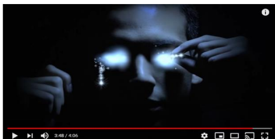
Figura 2: Disturbed, abra seus olhos!