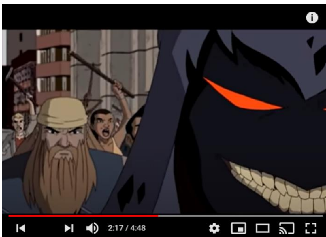
Figura 8: O povo segue seu líder

quebrar de correntes, como propõe a animação. Nesse processo, justamente a violência como conquistadora de direitos dos que o videoclipe concebe como os oprimidos pelo sistema. Logicamente, nessa liberação da violência, certa adesão fundamentalista, talvez por não ser mais “possível acordá-las [as massas] com os meios comuns da elevação da consciência e da educação” (ZIZEK, 2002, p. 23). Falhando, portanto, tais meios, como no clipe, voltamos sempre à violência como última instância ou possibilidade. Ao menos é o que temos no transcorrer do videoclipe de “Land of confusion”.