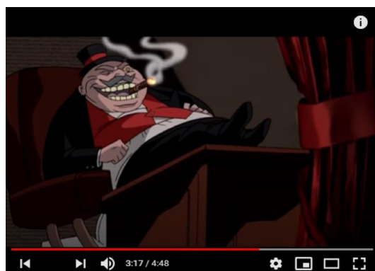
Figuras 5, 6 e 7: Land of confusion