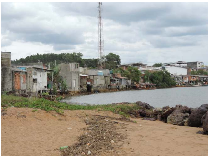
Imagem 2 – Vila de pescadores em Barra do Riacho (ES)