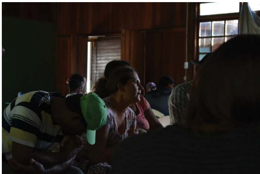
Imagem 3 – Oficina realizada em Regência