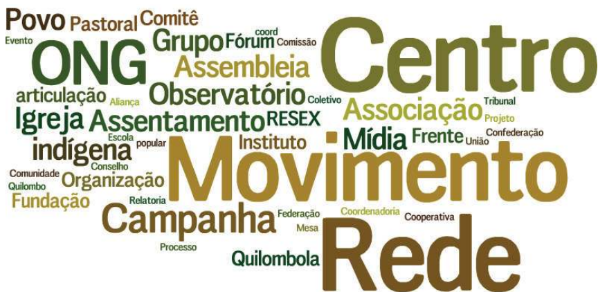
Imagem 1 – Tipos de mobilização