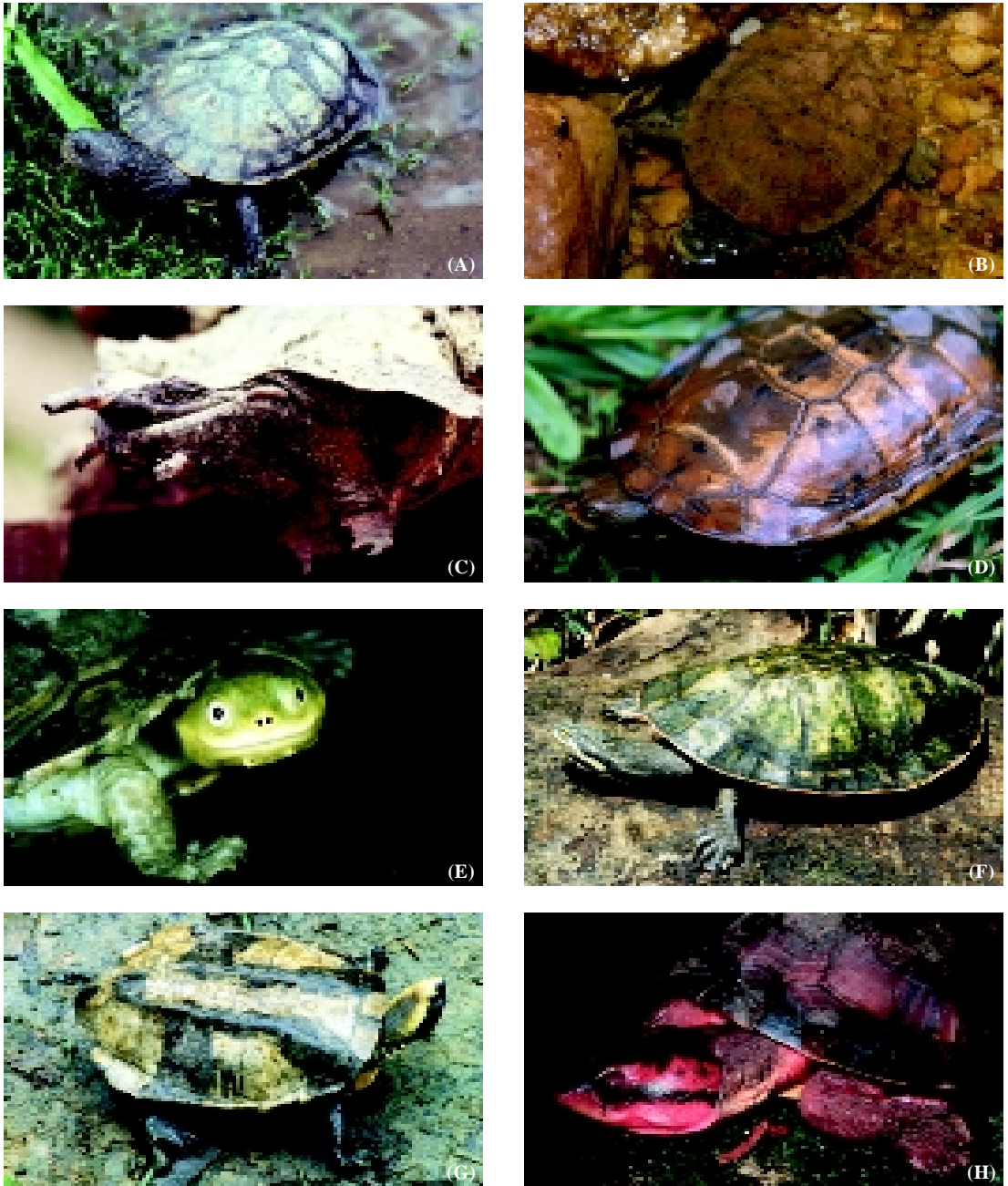
Figura 1 - Algumas espécies de Chelidae que ocorrem no Brasil. (A) Batrachemys tuberculata, Exu, PE, (B) Bufocephala vanderhaegei, Chapada dos Veadeiros, GO, (C) Chelus fimbriatus, Manaus, AM, (D) Hydromedusa maximilliani, Serra do Caraça, MG, (E) Mesoclemmys gibba, Rio Ajarani, RR, (F) Phrynops geoffroanus, Rio Formosa, RO, (G) Platemys platycephala, P. E. Guajara Mirim, RO, (H) Rhinemys rufipes, Manaus, AM