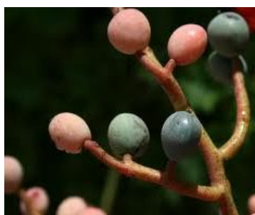
شکل شماره ۲. میوه بنه

است اما پوسته آن دارای رنگ سرخ اخراپی است که ترش مزه است. (شکل شماره ۲) آخرین مرحله، میوه رسیده بنه است که هسته آن کاملاً سخت شده و رنگ پوسته آن نیز در محدوده رنگی سبز تا سبز متمایل به آبی است. (شکل شماره ۲) بنه کاملاً رسیده همان بنه که لهوهن است