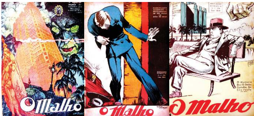
Capas da revista O Malho (impresso em 1934) ilustrando os contos policiais de João de Minas

As narrativas de Nos misteriosos subterrâneos de São Paulo provavelmente saíram em folhetim nos Diários Associados em quatro estados (São Paulo, Rio de Janeiro, Minas e Pernambuco), entre 1934 e 1935. Antes de publicá-lo integralmente, um trailer com os dois primeiros episódios apareceu na miscelânea Fêmeas e santas (1935). O livro completo finalmente saiu em julho de 1936, sob a rubrica da Imprensa Americana Editora, seguindo o costume da época, mencionado por Hallelwell, que levava os escritores a publicar livros com nomes de editoras fictícias.