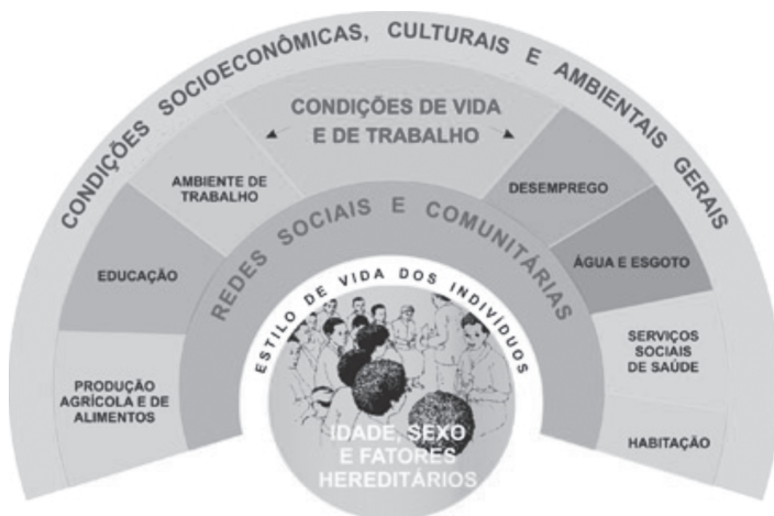
Figura 1 - Determinantes sociais: modelo de Dahlgren e Whitehead

A camada seguinte destaca a influência das redes comunitárias e de apoio, cuja maior ou menor riqueza expressa o nível de coesão social que, como vimos, é de fundamental importância para a saúde da sociedade como um todo. No próximo nível estão representados os fatores relacionados a condições de vida e de trabalho, disponibilidade de alimentos e acesso a ambientes e serviços essenciais, como saúde e educação, indicando que as pessoas em desvantagem social correm um risco diferenciado, criado por condições habitacionais mais humildes, exposição a condições mais perigosas ou estressantes de trabalho e acesso menor aos serviços. Finalmente, no último nível estão situados os macrodeterminantes relacionados às condições econômicas, culturais e ambientais da sociedade e que possuem grande influência sobre as demais camadas.