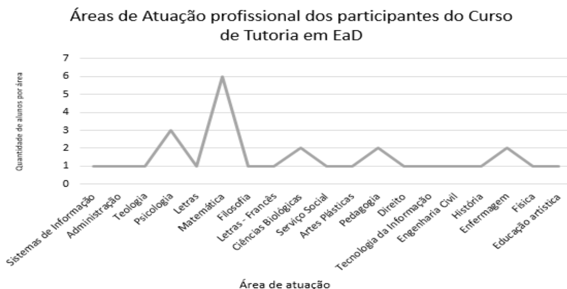
Figura 3. Área de Atuação dos participantes do Curso de Tutoria em EAD

Com base na análise de perfis de alunos de Tutoria em EAD é possível concluir que indiferente no grau de instrução, os profissionais que atuam na área da docência estão buscando atualizações para que possam se aperfeiçoar na tutoria em EAD e dessa forma poder auxiliar os alunos nos Ambientes Virtuais de Aprendizagem – AVA, em diferentes áreas de conhecimentos. Os graduados, especialistas, mestres e doutores, estão atuando em diferentes áreas de conhecimentos, tais como: ciências humanas, ciências exatas, ciências da natureza, biológicas e da saúde. A figura 3 retrata o cenário da área de atuação dos perfis dos Tutores em formação.