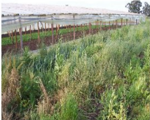
Foto 1: Ambiente semi-natural adyacente a la parcela de cultivo, en una de las fincas consideradas- La Plata-Argentina.

pertenecientes a las familias consideradas ecológicamente importantes por su rol como hospederas de enemigos naturales (ALTIERI y LETOURNEAU, 1984; SAINI y POLACK, 2002). Para el análisis estadístico se tuvieron en cuenta las siguientes variables por ambiente: riqueza específica; riqueza de familias; riqueza de géneros; número de especies pertenecientes a las familias Apiaceae (Ap), Fabaceae (Fb) y Asteraceae (As); número de las familias ecológicamente importantes en cada ambiente (Fb, Ap, As) y número de estratos verticales. Para el cálculo de esta última variable, se establecieron 7 estratos vegetales, con un rango de 0,25 m. cada uno, en base a la bibliografía de la vegetación de la zona (MARZOCA, 1976; CABRERA y ZARDINI, 1979).