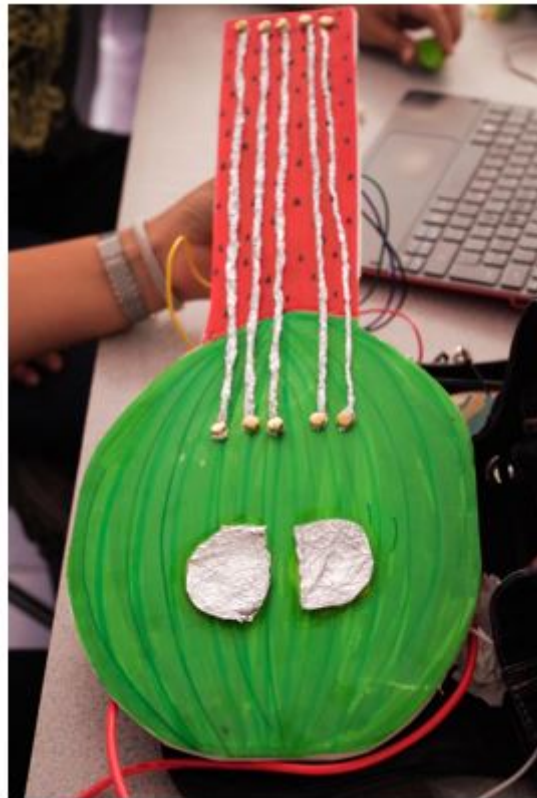
FIGURA 3 Guitarra elaborada con material reciclado