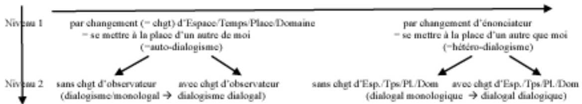
Figure 1. Les parcours empathiques et le jeu des points de vue

Ici, une brève mise au point : dans Rabatel (2016a : 143, écrit en 2013) j'avais proposé une autre formulation (schéma n° 1), qui me semble moins satisfaisante si on fait fonctionner le sens de la lecture de la gauche vers la droite et qu'on lui donne une signification qui laisse penser que ce qui est à droite vient après ce qui précède, tant au plan du déploiement dans le temps qu'à celui du développement de la complexité cognitive :