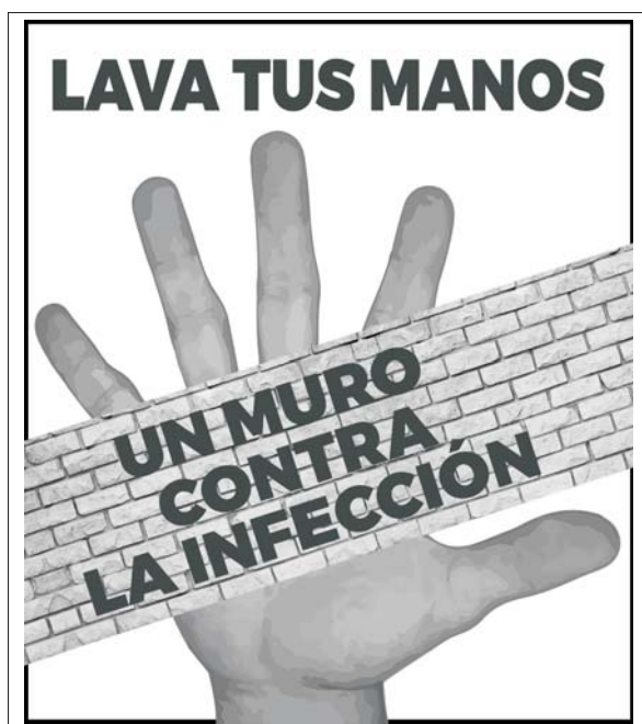
Figura 1. Importancia del lavado de manos.

percusión del empleo de antibióticos tiene mayor trascendencia: es responsabilidad de los comités de infección la implementación de enérgicas medidas de prevención y control, ya que son frecuentes los brotes intrahospitalarios por bacterias multirresistentes de difícil y oneroso manejo terapéutico. También el empleo de las vacunas disponibles contribuirá a reducir las enfermedades infecciosas, que además de prevenir esas enfermedades en los vacunados, según la etiología, pueden reducir la diseminación de bacterias, protegiendo indirectamente a la población no vacunada (24) .