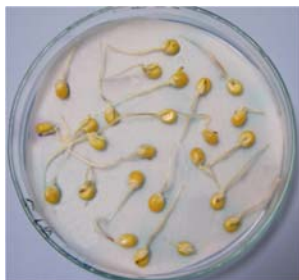
Slika 1. korijenak kukuruza na kontroli (destilirana voda)

Figure 1. corn radicule in control treatment