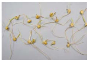
Slika 6. klica kukuruza na tretmanu s ekstraktom DATST

Figure 5. corn coleoptile in aq. extract of ABUTH