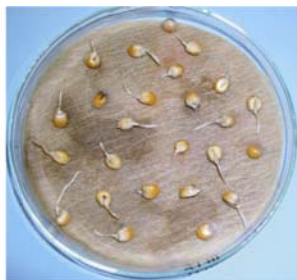
Slika 2. korijenak kukuruza na tretmanu s ekstraktom ABUTH

Figure 1. corn radicule in control treatment