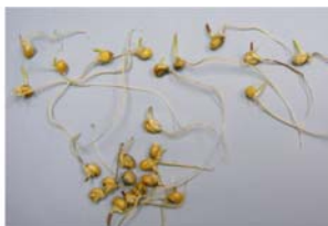
Slika 5. klica kukuruza na tretmanu s ABUTH

Figure 4. corn coleoptile in control treatment