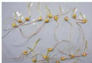
Slika 4. klica kukuruza na kontroli

Figure 3. corn radicule in aqueous extract of DATST