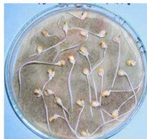
Slika 3. korijenak kukuruza na tretmanu s ekstraktom DATST

Figure 2. corn radicule in aqueous extract of ABUTH