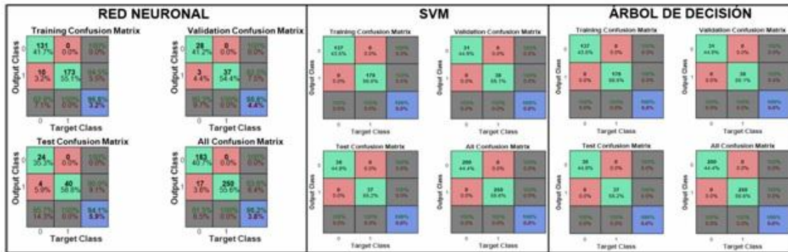
Fig. 4. Matriz de confusión de cada método de aprendizaje de máquina utilizado. En el entrenamiento de la red neuronal se obtuvo 96.8 % de acierto y 3.2 % de error, en la validación 95.6% de acierto y 4.4 % de error, y en la comprobación 94.1% de acierto y 5.9 % de error, para un desempeño general de 96.2 % de acierto y 3.8 % de error. La Máquinas de Soporte Vectorial (SVM) logró el 100% de los aciertos. El Árbol de decisión presentó 100 % de acierto en el entrenamiento, la validación y la prueba

para realizar el modelo, el tiempo empleado en la programación fue menor a 1s, en la matriz de confusión se observa el desempeño de la red, Figura 4 .