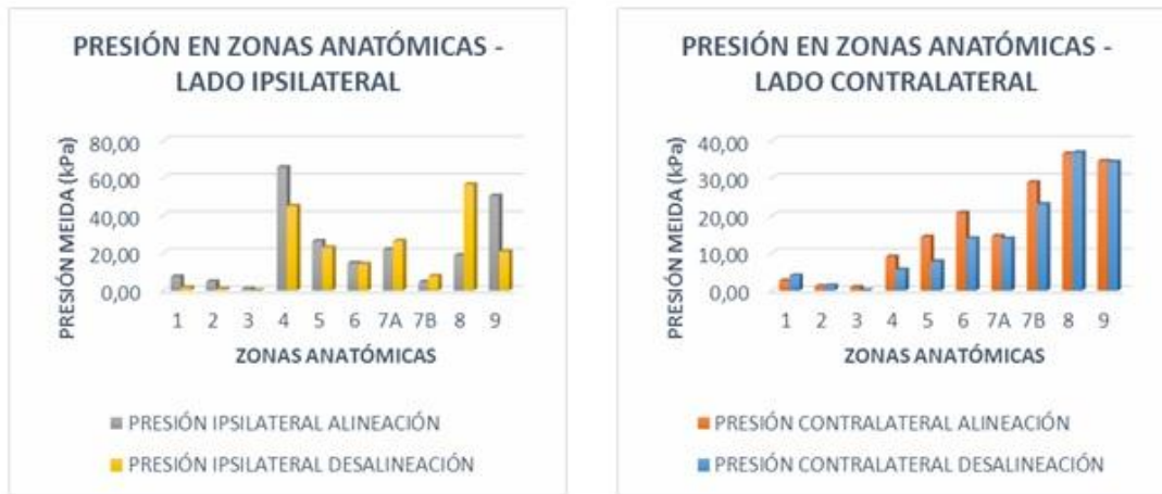
Fig 2. Comportamiento de la presión en las diferentes zonas anatómicas cuando la prótesis está alineada y en desalineación. En el lado ipsilateral la mayor presión se presenta en la zona 4, cuando la prótesis se encuentra alineada, teniendo cerca del 30 % de la presión total sobre el pie; en desalineación esta presión disminuye, llegando a estar cerca del 22 %. Cuando la prótesis se encuentra desalineada la mayor presión se ubica en la zona 8, donde soporta cerca del 28% de la presión total ejercida sobre el pie, este valor se ve alterado en alineación, pues disminuye hasta cerca del 9 %. Otra de las zonas más afectadas en desalineación es la zona 9, ya que pasa de soportar alrededor 22 % de la presión total al 9% en desalineación. En contralateral, las variaciones de presión de alineación a desalineación de la prótesis son menores a las mostradas por el lado ipsilateral, sin embargo las zonas más afectadas son 4, 5, 6 y 7B