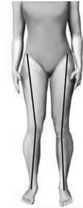
Figura 1 Ilustração da mensuração do ângulo frontal do joelho

considerada por Norkin e Levangie 18 como o centro articular do joelho e comumente visualizada por meio de exame radiográfico, não poderia ser estimada diretamente por imagens fotográficas.