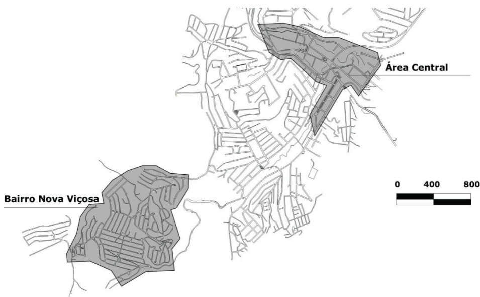
Figura 1 - Malha urbana de Viçosa com a delimitação das áreas de estudo: Bairro Nova Viçosa e Área Central.