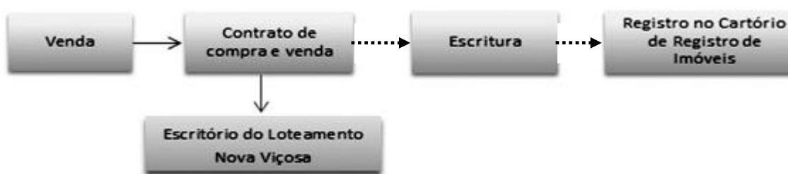
Figura 3 - Resumo esquemático do processo para a regularização dos lotes no Bairro Nova Viçosa, Viçosa-MG.

A segurança de posse que os moradores acreditam possuir também ampara a irregularidade. A primeira razão para essa crença é que a posse dos lotes nunca foi questionada. Outro motivo é o trabalho feito pelo Escritório do Loteamento Nova Viçosa, que realiza um controle informal de todas as transações imobiliárias no bairro. No processo de compra e venda, faz-se a averbação da transação imobiliária e é emitido outro contrato de compra e venda entre o Loteamento Nova Viçosa e o novo dono do lote, como se esse fosse o primeiro proprietário. Esse procedimento possibilita a regularização do lote em cartório, já que, mesmo com as vendas informais, o lote continua registrado como de propriedade do Loteamento Nova Viçosa, e somente este poderia conceder um recibo válido para tal transação. Porém, muitos compradores veem esse contrato de compra e venda como registro da propriedade, o que legalmente não é válido (DIAS et al., 2011). Esse processo está esquematizado na Figura 3. Como indicam as setas tracejadas, muitas vezes os moradores não completam o processo de regularização, possuindo apenas o contrato de compra e venda emitido pelo Loteamento Nova Viçosa.