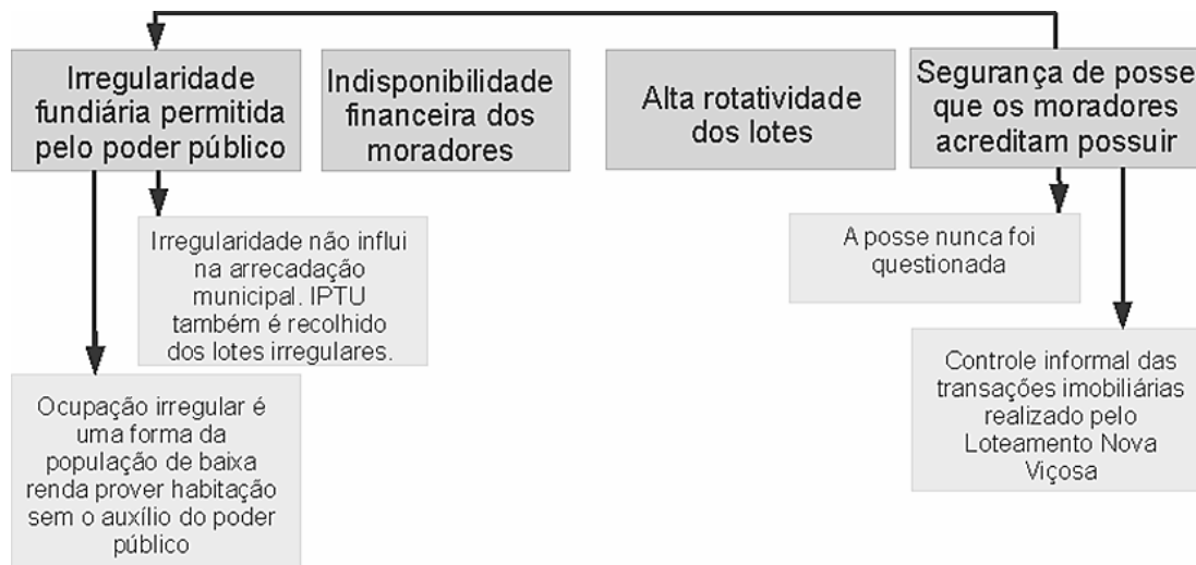
Figura 2 - Fatores que geram e sustentam a irregularidade fundiária no Bairro Nova Viçosa.

esquema apresentado na Figura 2. Como se observa, tais fatores vão além dos custos referentes ao registro do imóvel.