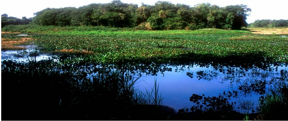
FIGURA 2. Lagoa do Diogo, Estação Ecológica de Jataí, Luís Antônio, SP.

do domínio da Fazenda Pública do Estado, no município de Luís Antônio, região centro-leste do Estado de São Paulo (Figura 3) (TANIGUCHI et al., 2004).