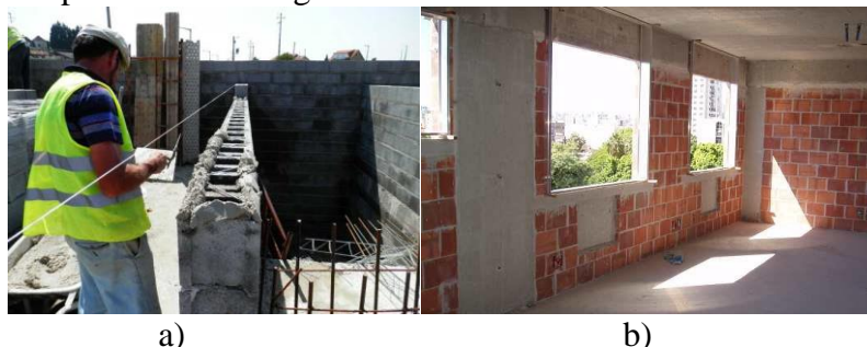
Figura 4 – Paredes; a) Sistema em alvenaria estrutural; b) Sistema em betão armado.

No sistema em estudo as paredes são uniformes, sendo que no convencional a transmissão das cargas desde as vigas até às sapatas é feita com recurso a pilares em betão armado, tal como representado na Figura 4.