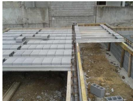
Figura 6 – Laje aligeirada com blocos de betão.

As lajes não apresentam diferenças significativas na sua execução dado que tanto as maciças como as aligeiradas (Figura 6) podem ser aplicadas em ambos os sistemas construtivos.