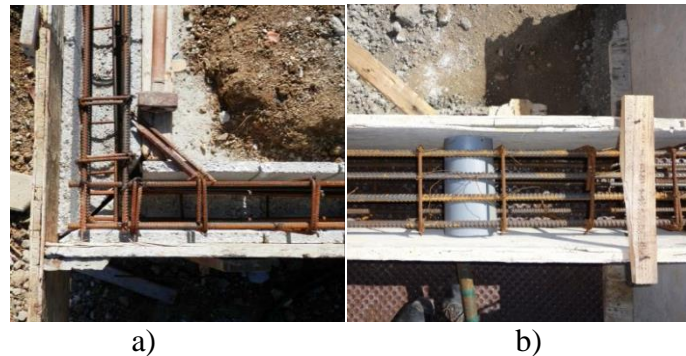
Figura 5 - Colocação de armaduras nas vigas; a) Alvenaria Estrutural; b) Betão armado

cargas e problemas a elas associados. Por outro lado, no sistema convencional normalmente recorre-se a vigas (Figura 5b)) em betão armado que descarregam as cargas diretamente nos pilares.