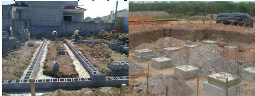
Figura 3 – Sapatas de fundação do sistema em alvenaria estrutural (esquerda) e em betão armado (direita)

O processo e faseamento construtivo entre os dois sistemas é similar, sendo que apresenta ligeiras diferenças, identificáveis na Figura 3. Desde logo para a alvenaria estrutural é exigido que a transmissão das cargas das paredes para o terreno seja feita a partir de sapatas contínuas o que no sistema em betão armado não é exigência, podendo ser feito com recurso a sapatas isoladas, permitindo uma poupança significativa de materiais como betão e aço.