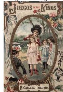
Figura 5. Noies a punt de jugar al puput o gallina ciega.