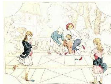
Figura 3. Joc de la xarranca, practicat per nois i noies.

Font: Los Juegos de la Infancia, 1897, p. 33.