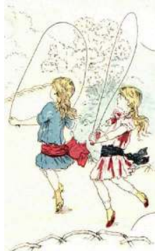
Figura 4. La corda, pràctica de noies, en l'obra Los juegos de la Infancia .

Aquesta sexualitat es fa palesa en diversos gravats (vegeu la figura 5) i també en els relats de José Osés (1915), que comenta que el joc està destinat indistintament als nois i a les noies i, per tant, hi jugarien plegats, fet que reforçaria aquesta connotació sexual, tot i que també indicaria la inclusió de la pràctica en el sexe masculí més tard que en el femení.