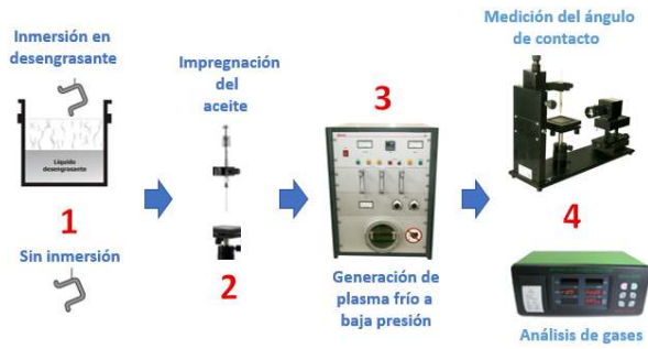
Figura 8. Procedimiento experimental.

Se realizó un predesengrase con una inmersión en un disolvente durante 3 minutos, de acuerdo con la cantidad de aceite a ser removido en la prueba de laboratorio. Para tratamientos industriales de limpieza para acero AISI/SAE 304 se recomienda de 30 a 60 minutos para eliminar compuestos orgánicos y remover los inorgánicos que pueden estar presentes en la superficie. La Tabla 4 presenta las propiedades del desengrasante utilizado. [21]