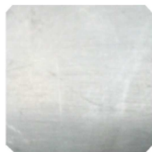
Figura 3. Placa de acero inoxidable.

No se consideró la rugosidad de la superficie del acero por no influir en el efecto que produce el gas ionizado de oxígeno sobre el volumen controlado de aceite depositado en la superficie.