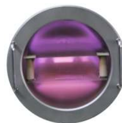
Figura 5. Cámara de plasma.

En la Figura 5 se observa la cámara de plasma al vacío donde se colocaron las láminas de acero inoxidable impregnadas de aceite, además, se compone de una bomba de vacío de paletas rotativas de dos etapas que tiene una presión residual cercana a cero y permite la ventilación de la cámara.