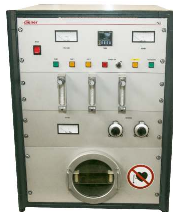
Figura 4. Generador de plasma.

El equipo generador de plasma utilizado es de marca Diener como se observa en la Figura 4, donde las partículas neutras e iones se suscitan entre los 25 a 100 °C con una temperatura electrónica entre los 105 °C a 5000 °C por medio de corriente continua y con presiones inferiores a los 133 mbar. El equipo es semiautomático donde se pueden utilizar tres gases diferentes para la generación del plasma y se pueden controlar los parámetros de presión, tiempo y potencia. [17].