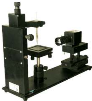
Figura 7. Goniómetro digital.

El goniómetro óptico utilizado para determinar el ángulo de contacto del líquido de prueba sobre la superficie metálica es de marca KSV CAM100 como se observa en la Figura 7. Tiene incorporado una cámara CCD (charge-coupled device) con 50 mm de óptica y un software CAM 100 para el tratamiento de la imagen. Para la medición del ángulo de contacto se utilizó 5 \mu l del líquido de prueba.