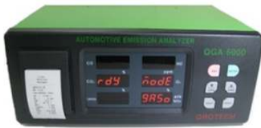
Figura 6. Analizador de gases.

en un rango de medición entre 0,00 ~ 0,99 %, que es altamente tóxico y puede ocasionar la muerte en niveles elevados, dióxido de carbono en un rango entre 0,0 ~ 20,0 %, que afecta al calentamiento global, oxígeno diatómico en un rango entre el 0,00 ~ 25,00 %, que no afecta al medioambiente, los hidrocarburos en un rango de medición entre 0 ~ 20000 ppm, que son combinaciones de carbono e hidrógeno, comúnmente implicados en las intoxicaciones y los NOx en un rango entre 0 ~ 5000 ppm, que son reactivos como el óxido nítrico (NO) y el dióxido de nitrógeno (NO 2 ) y muy perjudiciales para la salud, el ambiente y las estructuras. [18, 19]