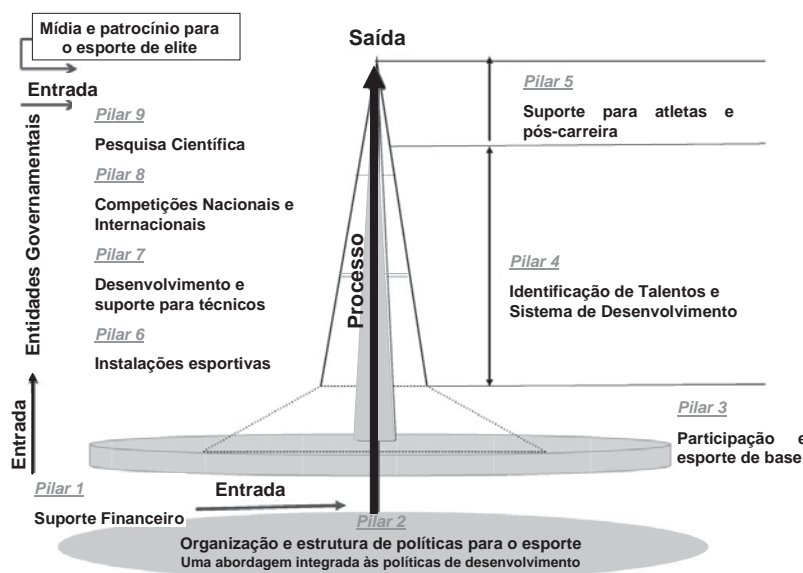
FIGURA 2 - Modelo do SPLISS. Modelo teórico dos nove pilares da estrutura esportiva que influenciam o sucesso internacional (traduzido de DE BOSSCHER et al., 2009).

O objetivo dos autores foi elaborar um modelo que permitisse a criação de um “Índice de Desenvolvimento Esportivo” de cada nação, com fundamento na comparação dos níveis de desenvolvimento de cada fator-chave considerado influente no sucesso esportivo internacional. A intenção é que este modelo possa servir de “benchmark” para outros países na área de formulação de políticas para o esporte de alto nível. Nesse sentido, foram estabelecidos os “Fatores Críticos de Sucesso” (FCS) para os “Indicadores” de