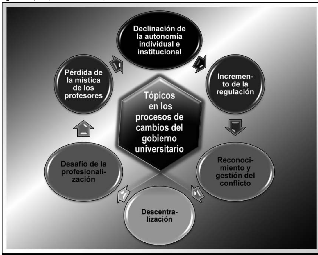
Figura 3- Tópicos predominantes en los procesos de cambio estructural