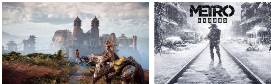
Gambar 2. (kiri) Footage game Horizon Zero Dawn dan (kanan) cover game Metro Exodus

game dengan genre cerita post apocalyptic , pengembang 4A Games meluncurkan judul Metro Exodus (kelanjutan seri Metro) pada Februari 2019. Metro Exodus mendapat nominasi dari majalah Develop untuk kategori Best Visual Arts dan Game of The Year . (Blake, 2019).