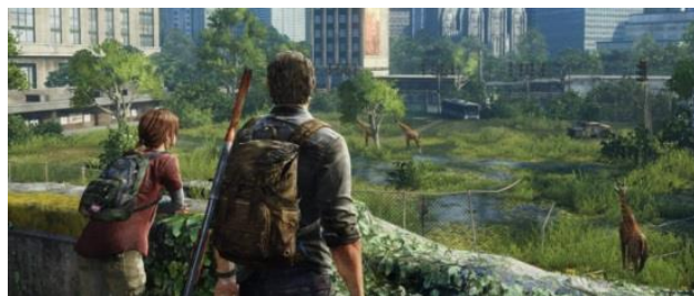
Gambar 1. Footage The Last of Us

Dalam industri video game, perkembangan teknologi ini terlihat dari makin variatifnya gameplay dan tampilan grafis yang ditampilkan. Efek lanjutan dari hal ini berdampak pada tata cerita dan tata visual yang menjadi inti dari sebuah judul video game. Dalam beberapa tahun ini, video games dengan genre cerita post apocalyptic cukup menjadi perhatian serta meraup keuntungan yang cukup besar. Beberapa contoh diantaranya seperti: The Last of Us yang dikembangkan oleh Naughty Dog yang terjual 1,3 juta salinan pada minggu pertama peluncuran dan mencapai 17 juta salinan pada 2018 (Tassi, 2013).