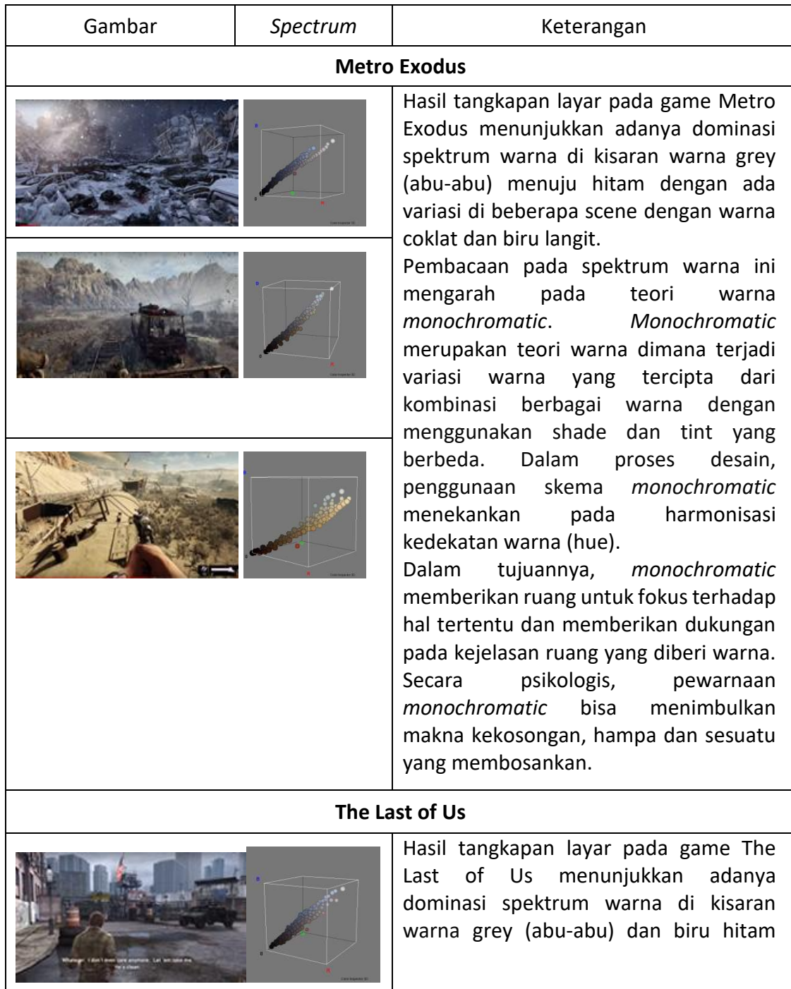
Tabel 1. Tabel analisis spektrum warna