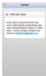
Gambar 12. Tampilan Halaman Menu Contact

Halaman menu contact ini berisi alamat e-mail pembuat aplikasi yang dapat dihubungi oleh pengguna bila ingin memberikan kritik dan saran pada aplikasi Mobile Hijab ini.