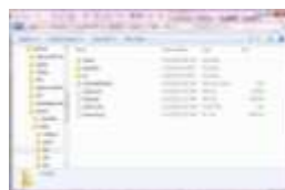
Gambar 13. Tampilan Folder Bin

Langkah pertama buka folder Workspace yang disimpan di drive D. Lalu pilih folder Aplikasi yang telah kita buat. Setelah itu buka folder bin , pilih nama Aplikasi yang telah dibuat dengan ekstension .apk .