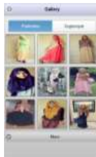
Gambar 4. Tampilan Halaman Menu Gallery

Halaman menu gallery ini berisi foto-foto dengan berbagai gaya berhijab. Pada menu ini, dibagi 2 pilihan kategori, yaitu kategori pashmina dan segiempat. Ini untuk membedakan foto-foto yang memakai kerudung model pashmina dan segiempat. Pada saat menu Gallery pada menu utama dipilih maka akan menampilkan pilihan sebagai berikut :