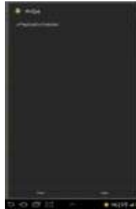
Gambar 16. Tampilan Proses install Aplikasi Selesai

Setelah semua proses telah selesai dilalui, klik open, lalu aplikasi tersebut dapat digunakan dan secara langsung akan tertera icon Mobile Hijab atau MHijab dalam Menu di Smartphone.