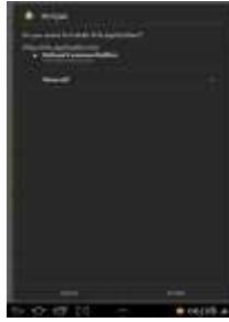
Gambar 15. Tampilan Proses Penginstalan Aplikasi