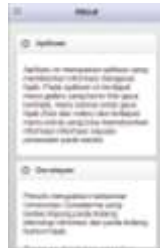
Gambar 11. Tampilan Halaman Menu About

Halaman menu about ini berisi keterangan-keterangan tentang aplikasi Mobile Hijab dan juga keterangan tentang pembuat aplikasi.