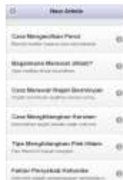
Gambar 9. Tampilan Halaman Menu Article

Halaman menu article ini berisi artikel-artikel yang membahas masalah-masalah yang sering dialami oleh berbagai kalangan. Untuk membuka halaman article ini dibutuhkan koneksi internet karena data-data pada menu ini selalu ter- update .