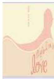
Gambar 2. Tampilan Halaman Menu Pembuka

Halaman pembuka ini berupa tampilan gambar yang muncul beberapa detik pada saat icon aplikasi Mobile Hijab MHijab ini diklik. Splash screen tersebut terdiri dari judul aplikasi dan gambar yang memberikan ciri khas dari aplikasi ini. Fungsi dari splash screen hanya sebagai pembuka dari aplikasi.