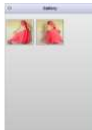
Gambar 5. Tampilan Halaman Menu Gallery

Pada halaman galeri ketika salah satu fotonya diklik, gambar tersebut akan pindah ke halaman baru, dan akan menampilkan foto-foto dengan model yang sama namun dengan gaya yang berbeda.