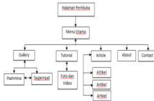
Gambar 1. Struktur Navigasi

Pada aplikasi ini menggunakan struktur navigasi hirarki, yaitu suatu struktur yang mengandalkan percabangan untuk menampilkan data atau gambar pada layer dengan kriteria tertentu. Struktur navigasi aplikasi ini terdapat pada gambar berikut: