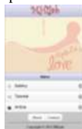
Gambar 3. Tampilan Halaman Menu Utama

Setelah halaman splash screen selesai ditampilkan, maka akan menuju halaman utama yang di dalamnya terdapat beberapa menu utama untuk memberikan informasi tentang MHijab.