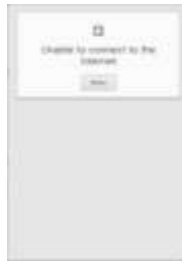
Gambar 8. Tampilan Halaman Video Tanpa Koneksi Internet

Jika dalam membuka menu tutorial video tidak adanya koneksi internet, video yang dipilih tidak bisa dibuka dan tampilannya adalah seperti yang tertera pada Gambar: