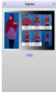
Gambar 7. Tampilan Halaman Menu Tutorial

tutorial video berisi cara penggunaan hijab, namun tutorial video tidak selalu sama dengan tutorial foto. Halaman ini merupakan halaman yang dapat dibuka dengan bantuan koneksi internet. Saat pengguna menekan tombol video, arah jalan tombol tersebut adalah link menuju Youtube.