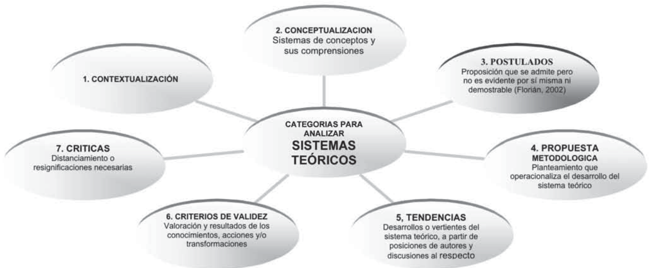
Figura 1. Categorías para analizar sistemas teóricos en Trabajo Social.