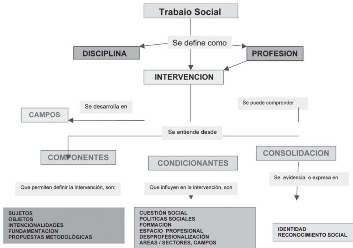
Figura 2. Mapa conceptual para comprender holísticamente la intervención profesional de TS 6

el carácter relativo, perspectivo del conocimiento, para comprender y proyectar de forma pertinente y significativa la intervención (Cifuentes, 1998). En Trabajo Social el profesional se inserta directamente en la realidad social, involucra un saber científico, académico, disciplinar, intuitivo y valorativo (Olaya y otros, 2008). A continuación se presenta el mapa conceptual que sintetiza una propuesta de comprensión compleja de la intervención profesional de Trabajo Social, como aporte al proceso de reconfiguración: incluye distinciones, en la perspectiva de visualizarla integralmente, como profesión como aporte a la construcción disciplinar.