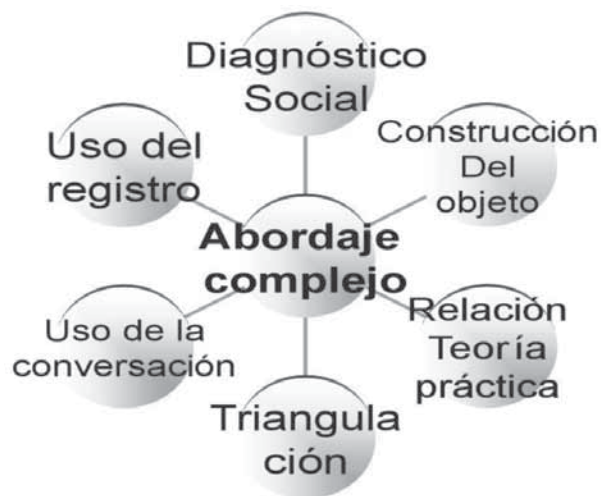
Figura 4. Abordaje complejo en la intervención profesional de Trabajo Social

Es necesario analizar las especiales implicancias de la relación práctica social-teoría- método en el área de las ciencias humanas o sociales. Ellas no estudian hechos exteriores a los hombres, son por el contrario, el estudio de la acción humana, de su estructura y de sus objetivos. El objeto de las ciencias sociales tiene la característica de no ser solo un objeto, sino objeto y sujeto a la vez. Estableciéndose entre el objeto y el investigador una relación que modifica a ambos (Aylwin, 1999).