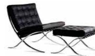
Cadeira Barcelona.

Poltronas podem oferecer conforto, como também serem objetos de decoração que atingem a sensibilidade do homem por apresentarem materiais e formas que lhe atribuem significados. Metal e couro são materiais que indicam requinte, e as formas orgânicas conferem leveza ao produto. O conforto é pensado posteriormente à identificação da forma e assimilação de seus significados vindos da experiência.