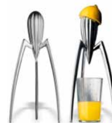
Espremedor de laranjas de Philippe Starck.

O ato de sentar em pedras e troncos na pré-história evoluiu com o desenvolvimento do mobiliário. Descanso e conforto são buscados pela essência humana.