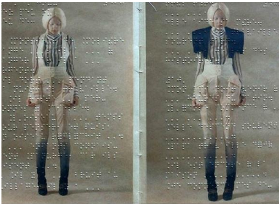
Figura 6: Peças desenvolvidas em braille.