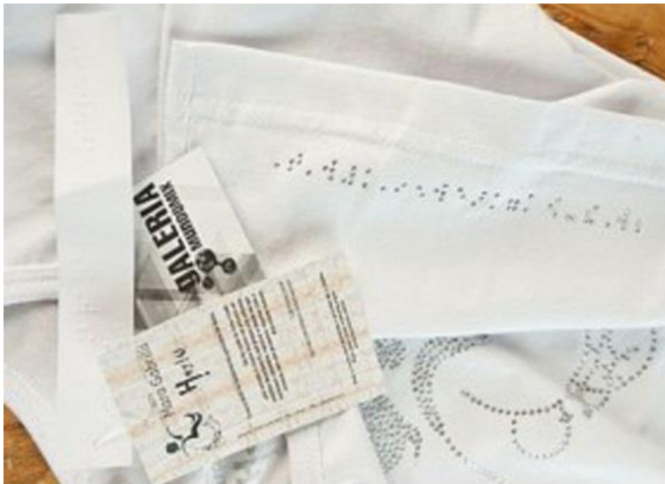
Figura 5: Etiqueta desenvolvida em braile.

Segundo Grave (2004), a roupa deve proporcionar conforto de modo que seu dia a dia ao colocá-la não deve ser lembrado como algo que deve ser tirado como se libertasse do “estresse”. Ela deve ser facilitadora para pessoas com deficiência, seja em aspectos ergonômicos tais como desde o momento de colocar a roupa e tirá-la, como também de escolhê-la no processo de compra. Deve ser considerada mobilidade, textura, maleabilidade, medidas, caimento, etc. Todos estes são detalhes relevantes na usabilidade. Apesar de o mercado oferecer algumas soluções, tais como o caso da etiqueta de roupa especial para deficientes visuais, ainda carece de inovações no quesito citado acima. Isto porque ainda não há lei que obrigue as empresas a desenvolverem estas etiquetas ou mesmo desenvolver peças voltadas ou aprimoradas para este público. Esta etiqueta trata-se de um material emborrachado em braile de modo que descreve a cor do produto, o diferencial dela é que consegue proporcionar algumas informações necessárias sem ocupar muito espaço, isto porque o braile ocupa mais espaço que uma escrita normal (FRANÇA, 2011).