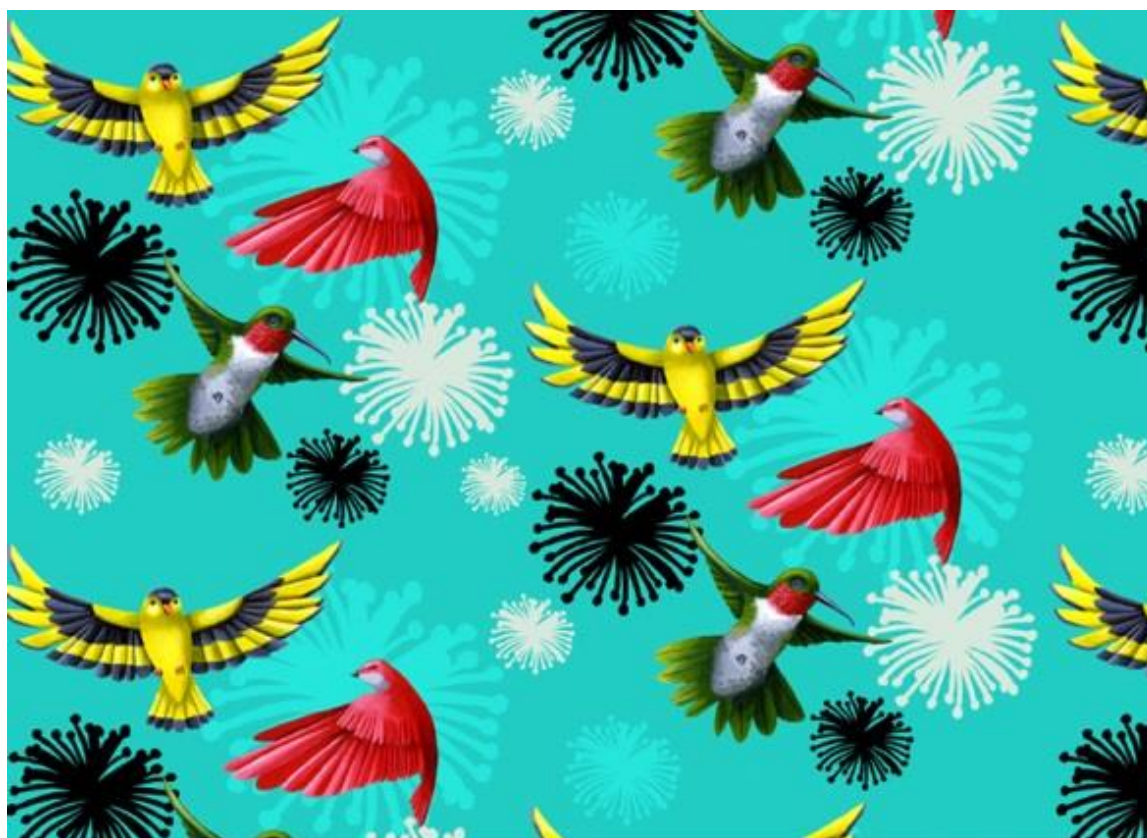
Figura 1: Rapport.