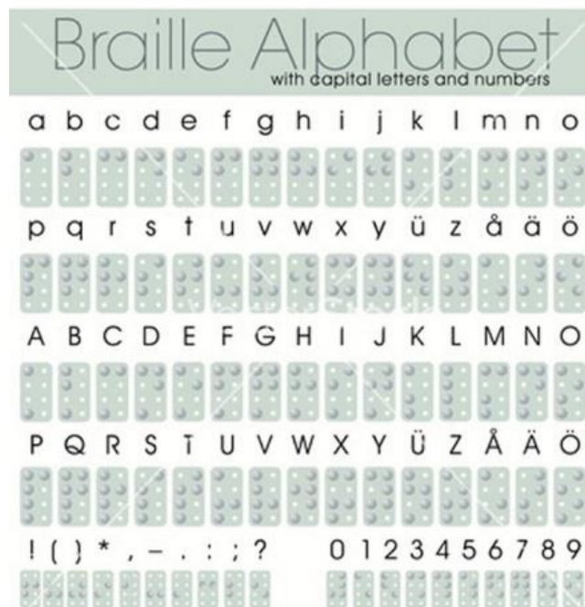
Figura 4: Alfabeto em braille