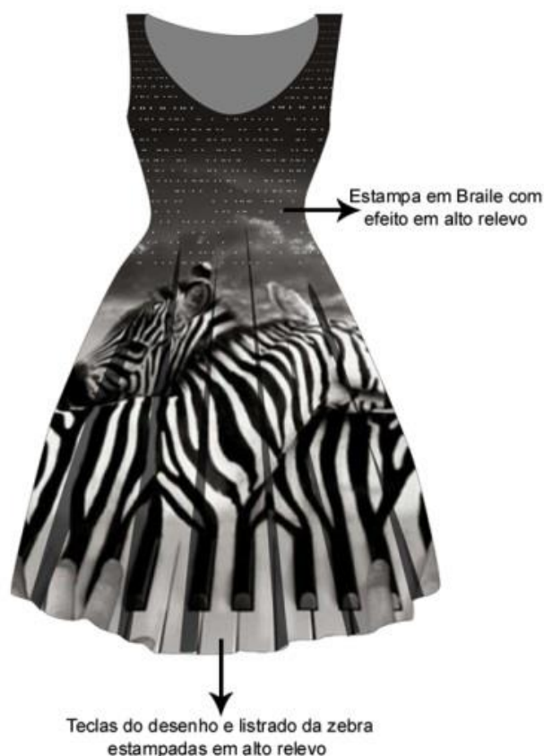
Figura 7: Vestido em braile.

universal, buscando atingir o maior número de usuários possível, sem distinção. Estes detalhes buscam oferecer condições ao deficiente visual na identificação da peça, favorecendo sua autonomia também no processo de escolha. Para isto, as propostas foram desenvolvidas a partir dos conceitos de design inclusivo, design universal, tecnologia assistiva e o design de superfície (Figuras 3 e 4).