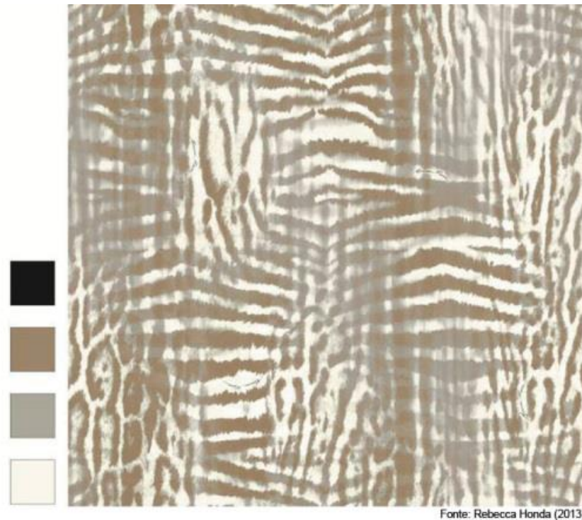
Figura 2: Separação de Cor.

A estamparia digital é um processo que ocorre por meio de impressão de tinta direto no tecido, por impressoras grandes denominadas estamparia jato de tinta. Por meio do processo de digitalização da imagem que é a regulamentação de medidas, o desenho no computador é transferido para a impressora. O custo é mais alto que os processos convencionais de quadros e cilindros, mas a qualidade da estampa que se consegue atingir é perfeita (LEVINBOOK, 2008).