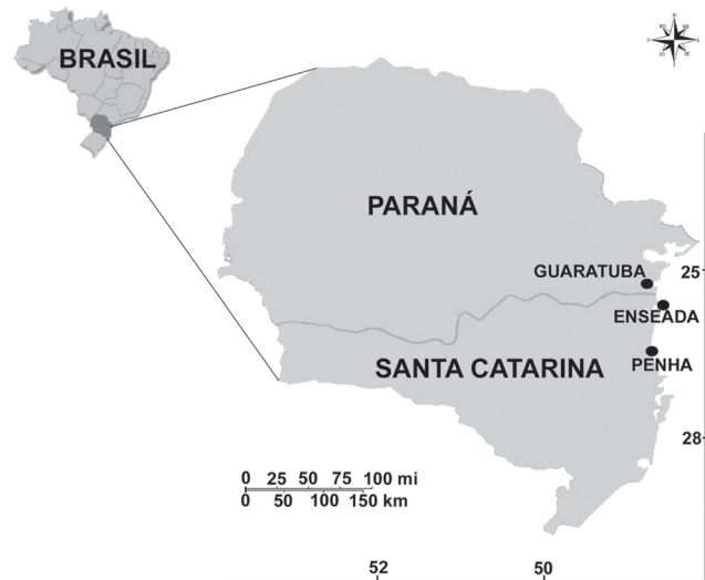
Figura 1. Localização da comunidade de Enseada no litoral sul do Brasil. Os pontos Guaratuba e Penha indicam comunidades junto às quais a captura incidental de arrasto foi estudada por GOMES & CHAVES (2006) e BRANCO & VERANI (2006), respectivamente.

A reprodução foi avaliada com uso de três indicadores: (I) % de indivíduos “em reprodução”, ambos os sexos; (II) Índi-