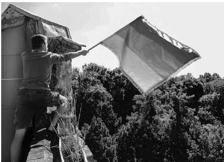
Імператор з прапором Австро-Греції

адже перебуваючи на межі двох безодень — нескінченності і небуття, вона не здатна охопити розумом ні те, ні інше, і виявляється чимось середнім між всім і нічим. Здавалося б, що такого роду небезпечні думки могли б незворотно порушити хиткий гомеостразовий баланс австро-грецької психіки. Але дух Австро-Греції з гідністю пройшов через це підступне випробування, втримав рівновагу та продовжив свою ходу» [3, с. 6]. Згідно з глосарієм «гомеостраз» — це також один з характерних неологізмів, який означає улюблений стан повсякденного життя австро-грека. Мається на увазі той потяг до накопичення, розширення поля для поступового розвитку «соціуму спектаклю» Гі Дебора та «соціуму споживання» Ж. Бодріяра, особливо у ХХ столітті.