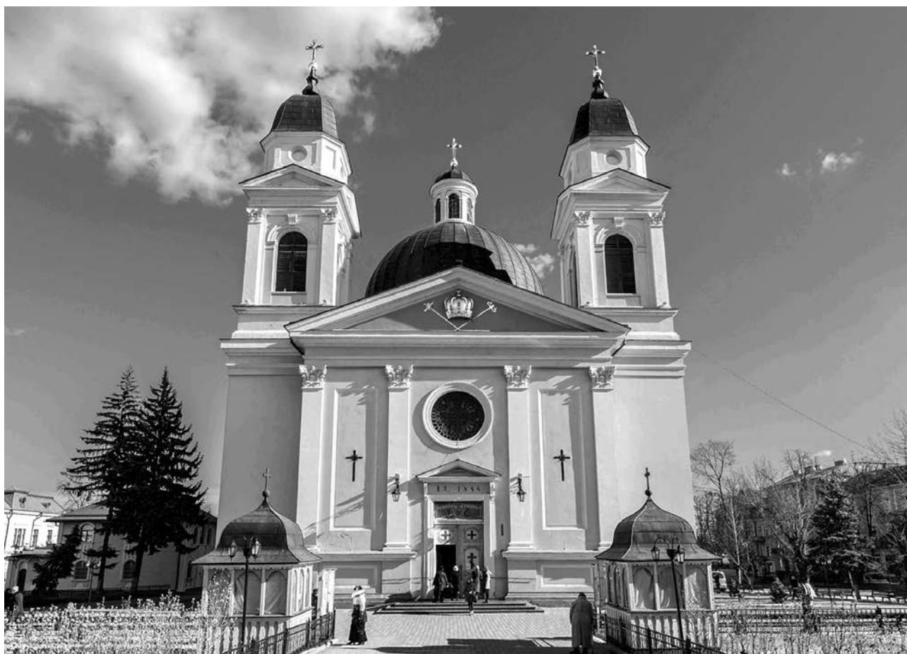
«Рожевий Онурій». Кафедральний собор Святого Духа в Чернівцях