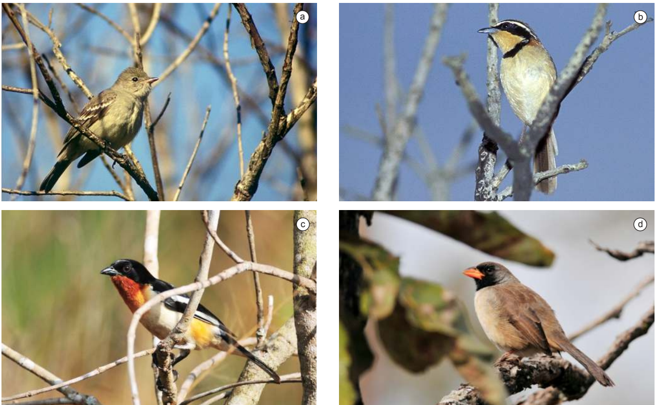
Figura 3. a) Chibum ( Elaenia chiriquensis ), migratória que aparece na Estação Ecológica de Itirapina, SP na primavera e verão, b) Tapaculo-de-colarinho ( Melanopareia torquata ), endêmica de cerrado, c) Bandoleta ( Cypsnagra hirundinacea ), endêmica de cerrado, e d) Bico-de-pimenta ( Saltator atricollis ), endêmica de cerrado.

Em quase todas as visitas a EEI foi possível observar pequenos bandos de Rhea americana usando principalmente o campo sujo e o campo limpo. No entanto, há uma controvérsia sobre a origem destas, apesar de muito provavelmente ocorrerem na região antes da ocupação humana, de acordo com Yoshica Oniki (com. pessoal) houve uma reintrodução ou recolonização dessa espécie a partir dos anos 1950-1960. Entretanto, o importante é que há um bom tempo as emas