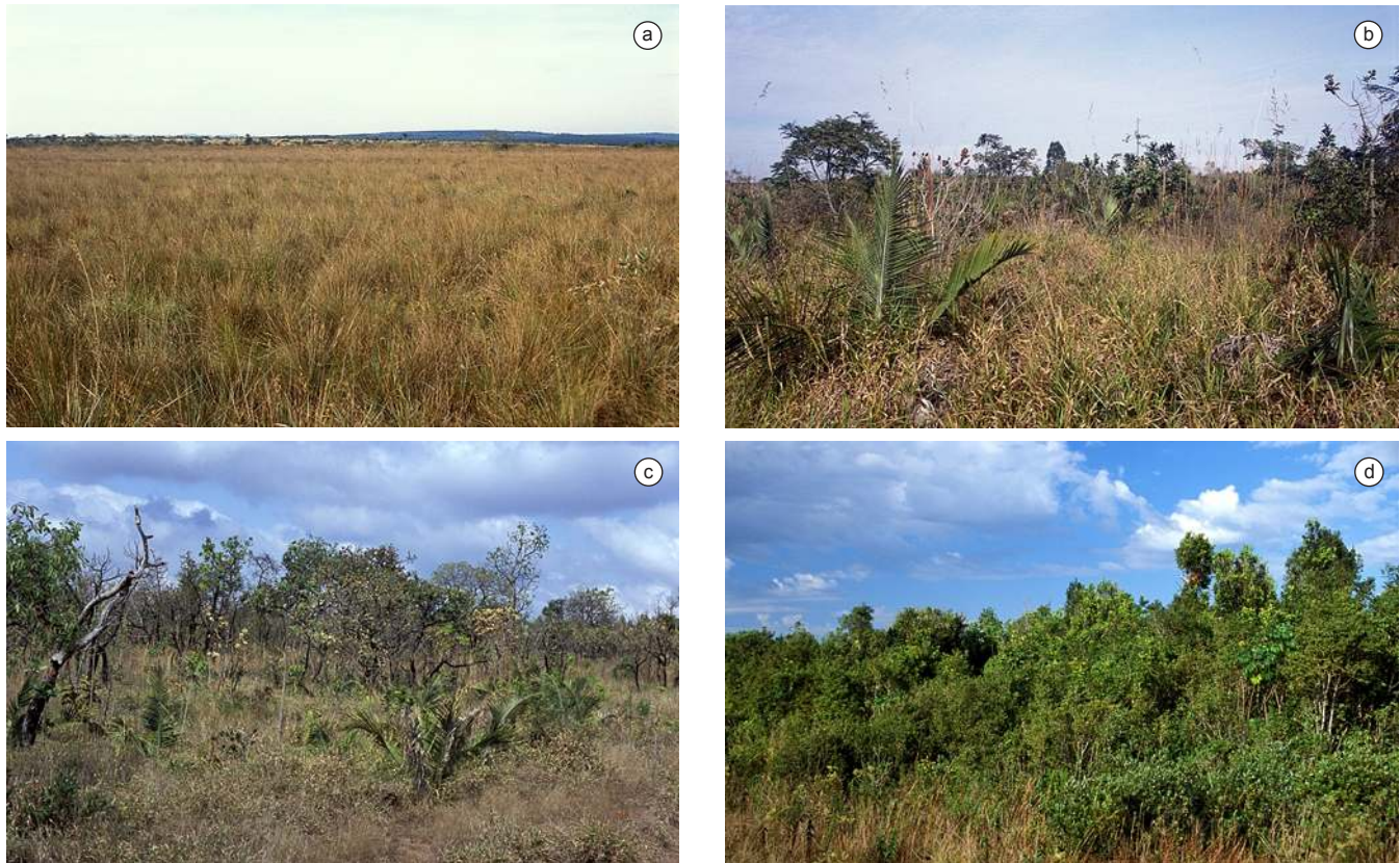
Figura 2. a) Campo limpo na Estação Ecológica de Itirapina, SP, onde, em algumas áreas, com a estação das chuvas, podem surgir lagoas temporárias, b) Campo sujo, c) Campo cerrado, e d) Mata de galeria.