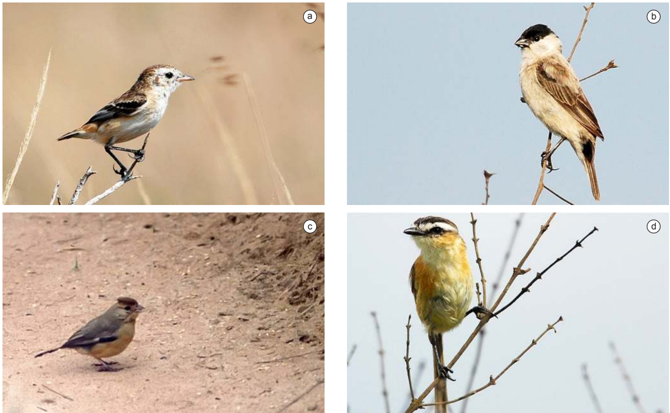
Figura 4. a) Galito ( Alectrurus tricolor ) fêmea ou macho subadulto (veja Ridgely & Tudor 1989), b) Caboclinho ( Sporophila bouvreuil pileata ), c) Fêmea de Mineirinho ( Charitospiza eucosma ), endêmico de cerrados abertos e raramente visto na EEI, como nesta foto de fevereiro de 2002, e d) Papa-mosca-do-campo ( Culicivora caudacuta ), em perigo no estado de São Paulo. © J.C. Motta-Junior.

Figure 4. a) Cock-tailed Tyrant ( Alectrurus tricolor ), female or subadult male (see Ridgely & Tudor 1989), b) Capped Seedeater ( Sporophila bouvreuil pileata ), c) Coal-crested Finch ( Charitospiza eucosma ) female, an open cerrado endemic species rarely observed in the EEI, as in this photo of February 2002, and d) Sharp-tailed Tyrant ( Culicivora caudacuta ), endangered in the state of São Paulo. © J.C. Motta-Junior.