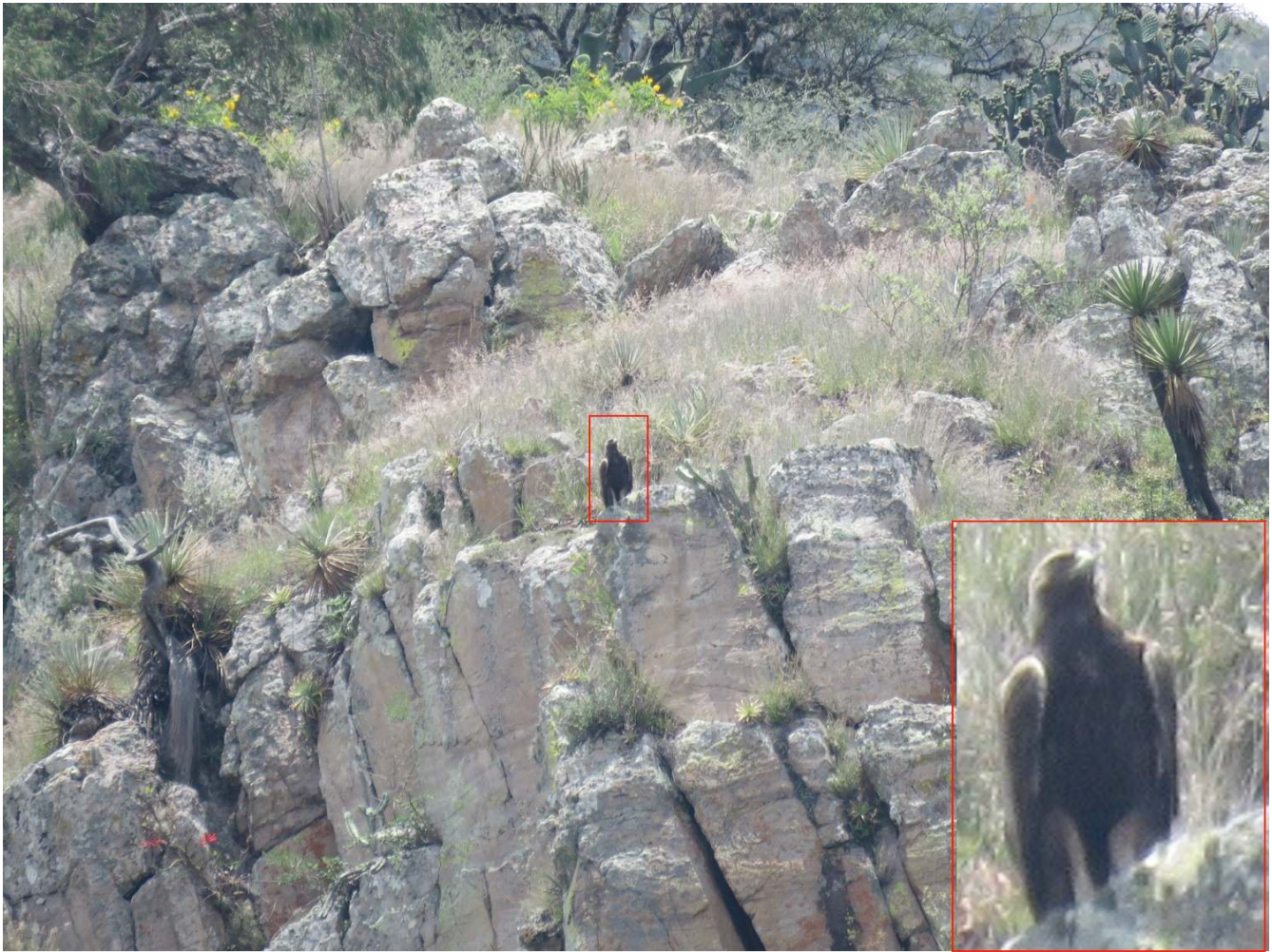
Figura 1. Individuo adulto de águila real perchado en una ladera en Mesita del Tigre, Guanajuato.

da; cabe señalar que los vimos en la misma área durante dos días, lo cual interpretamos, basados en experiencias previas con otras parejas de águila real de los estados de Aguascalientes y Zacatecas, que esta área forma parte de su territorio habitual de caza.