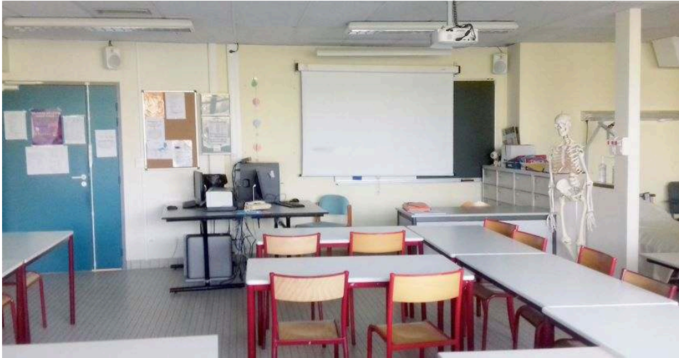
Photographie 1 : salle de classe de bac pro ASSP avec le squelette Oscar