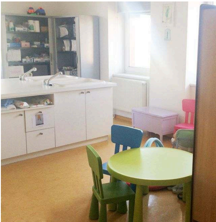
Photographie 3 : Salle de cours avec un espace dédié aux savoirs liés aux enfants