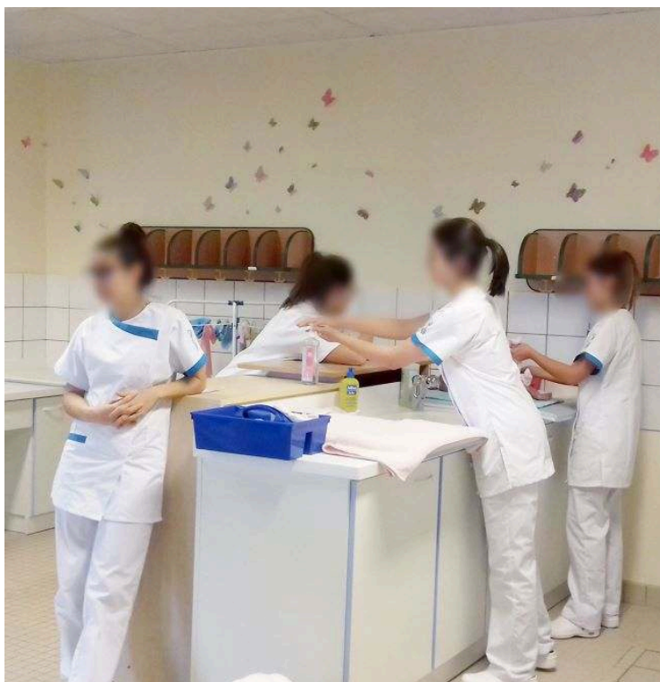
Photographie 7 : Des élèves en cours dédié aux soins destinés aux nourrissons