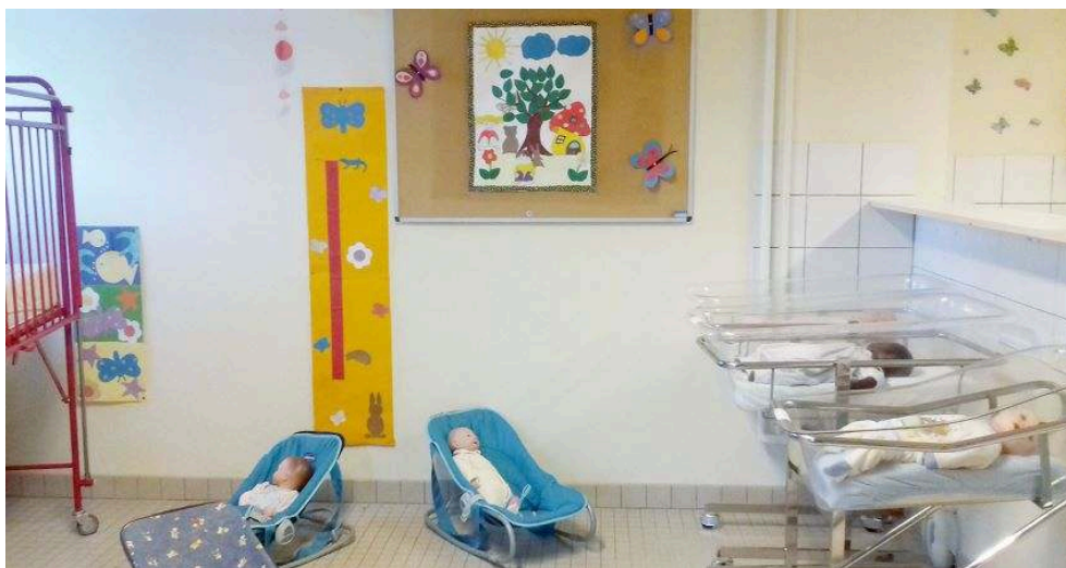
Photographie 5 : Espace nurserie d'un lycée professionnel