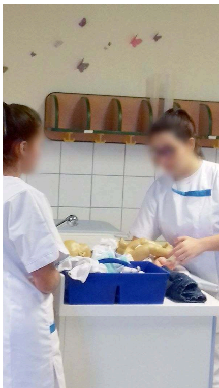
Photographie 8 : Des élèves de bac pro « Accompagnement, soins et services à la personne » dans un exercice de change du nourrisson