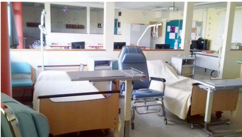
Photographie 2 : Salle de cours avec un espace dédié aux savoirs liés aux adultes