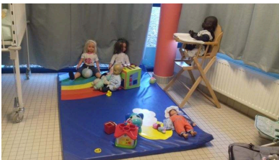
Photographie 4 : Espace dédié à la petite enfance d'un lycée professionnel