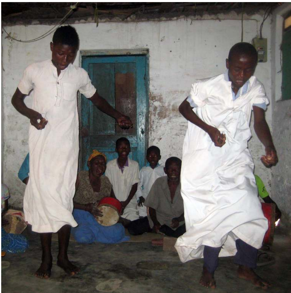
Manifestação Maulide . Ilha de Moçambique, 2016.

O shehe , como principal líder das confrarias, recebe a silsila , isto é, um documento escrito que lhe concede autoridade como representante e constitui uma rede genealógica de mestres. 60 Na tariqa (confraria) existiam outros car-