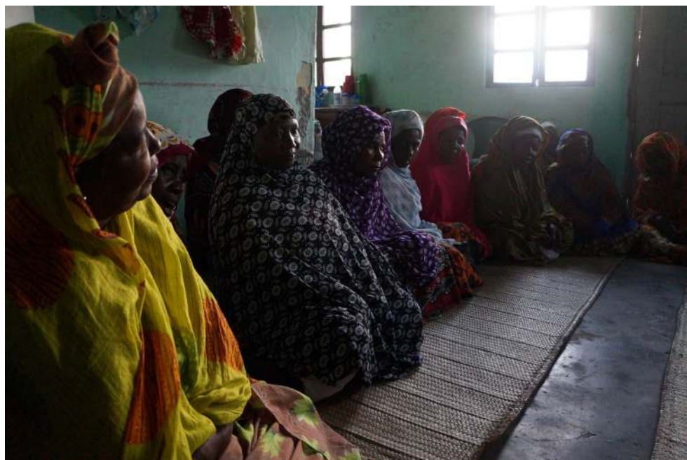
Acervo Digital Suaflí. Reunião das mulheres da confraria Shadhiliyya . Ilha de Moçambique, 2016.

Atualmente essas reuniões e manifestações acontecem em lugares privados, nas residências das halifas ou nas mesquitas. Porém, em datas comemorativas específicas do calendário muçulmano, são realizadas em espaço público.