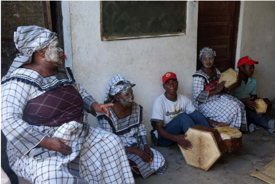
Músicos e instrumentos do tufo Estrela Vermelha. Ilha de Moçambique, 2016.

Com relação aos gestuais, há informações de que, no passado, os dançarinos ficavam ajoelhados, movimentando apenas a parte superior do corpo: busto, cabeça, ombros, braços e mãos. Seguravam, algumas vezes, um pano branco nas mãos. Este pode ser um símbolo referente ao Islã, cuja cor branca ocupa um lugar importante nos rituais. É muito comum o uso da cabaia branca em diferentes cerimônias muçulmanas, sendo observada também na manifestação de maulide.