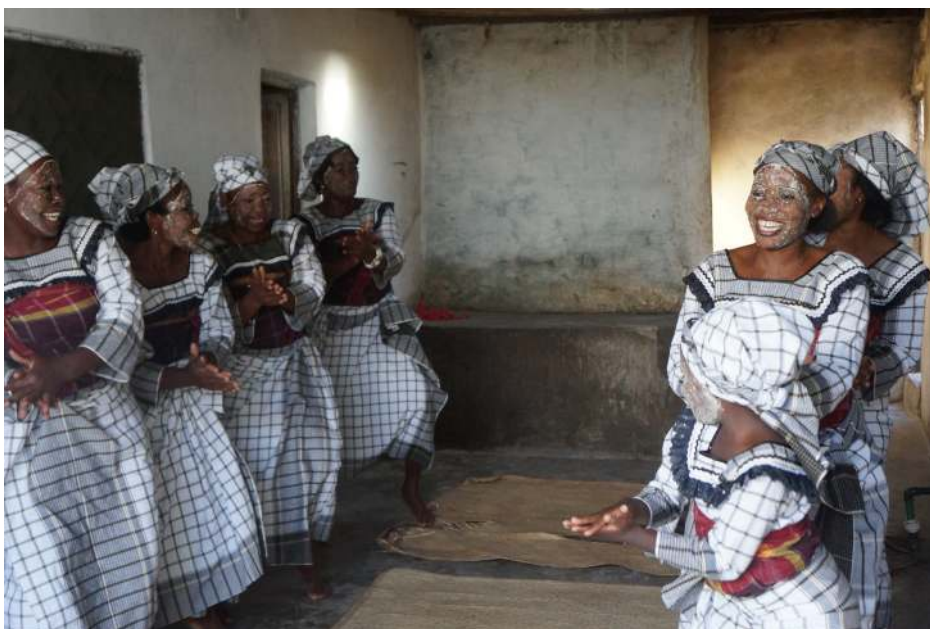
Acervo Digital Suaíli. Apresentação do tufo Estrela Vermelha. Ilha de Moçambique, 2016.