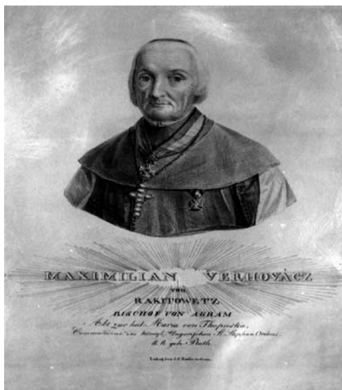
Maksimilijan Vrhovec (1752-1827), pokrovitelj i priređivač kajkavske Biblije.