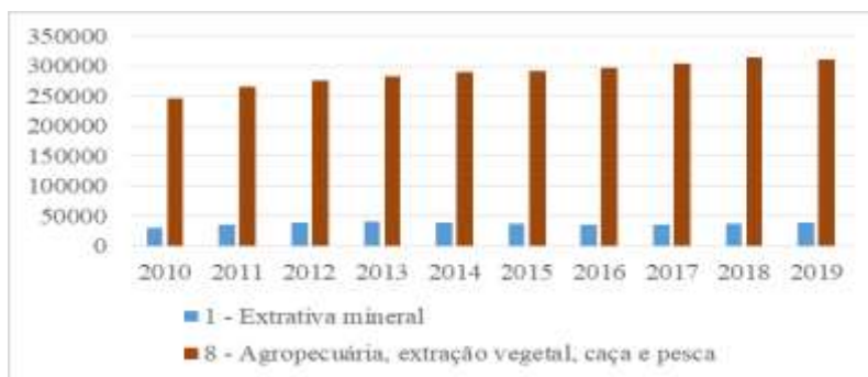
Figura 2. Número de empregos - Setor extrativo mineral, agropecuária, extração vegetal, caça e pesca da Amazônia Legal.

Nota. A figura traz a evolução do número de vínculos efetivos em 31/12 de cada ano nos Estados da Amazônia Legal. Nota-se um crescimento dos empregos na agropecuária, extração vegetal, caça e pesca e certa estabilidade do setor extrativo mineral.