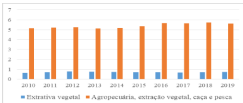
Figura 3. Percentual de participação do setor extrativo mineral, agropecuária, extração vegetal, caça e pesca da Amazônia legal em relação aos empregos totais.

Nota. Observa-se que a participação dos empregos no setor extrativo mineral é menos de 1% na série histórica 2010-2019. A participação da agropecuária, extração vegetal, caça e pesca mostra-se mais relevante, em torno de 5% no período analisado.