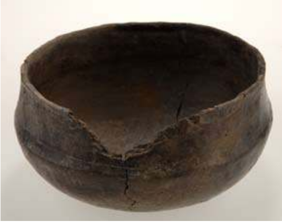
Figur 1. Keramik av östersjöfinsk typ från Birka, Bj 731.