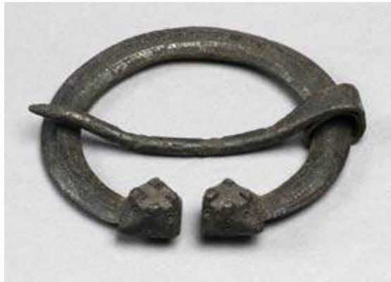
Figur 2. Ringspänne med facetterade och piggförsedda knoppar från grav 1053

intill varandra. Detta kan indikera att de gravlagda personerna tillhört samma familj, släkt eller annan typ av social gemenskap.