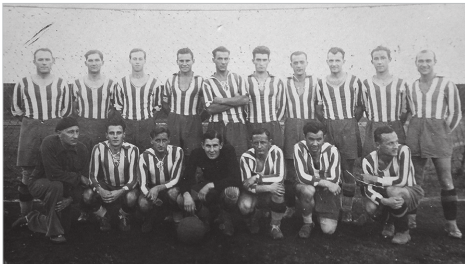
Moštvo SK Ljubljane iz leta 1939, ko so črno-beli še zadnjič nastopili v končnici jugoslovanskega državnega nogometnega prvenstva

Tekmeci, predvsem tisti iz vrst mariborskega SK Železničarja, so začutili priložnost, da bi se SK Ljubljani lahko približali in morda ogrozili njihovo pot do ligaškega naslova, kar se je na koncu izkazalo za izvedljivo. Gledalci so bili tako priče verjetno najbolj izenačenemu prvenstvu na slovenskih travnatih zelenicah v obdobju med obema vojnama, odločitev o prvaku pa je padla šele v zadnjih kolih, saj so mariborski Ajzmponarji do konca dihali za vrat Ljubljančanom. Ljubljančani so si na koncu z veliko mero sreče sicer vseeno uspeli zagotoviti naslov najboljšega moštva v slovenski nogometni ligi, z zmago v prvenstvu pa so si obenem zagotovili tudi nastop v zaključnih bojih za naslov prvaka kraljevine Jugoslavije, vendar je bilo jasno, da se v slovenskem nogometnem prostoru v prihodnje obeta bolj izenačen boj za najvišja mesta v državnem prvenstvu, mnogi pa so bili prepričani, da je le še vprašanje časa, kdaj bo SK Ljubljano na slovenskem nogometnem Olimpu zamenjal kak drug klub. Odgovora na to vprašanje slovenski ljubitelji nogometa žal niso nikoli dobili, saj je začetek druge svetovne vojne za nekaj časa povsem prekinil vsako nogometno aktivnost v Jugoslaviji, Ljubljančane pa tudi prikrajšal za nastop v končnici državnega prvenstva za sezono 1940–1941. 113