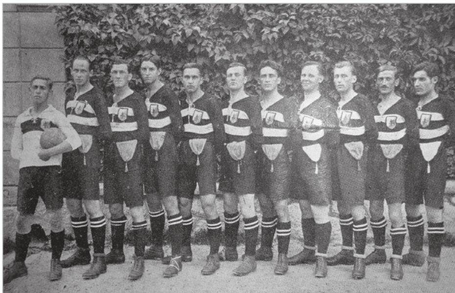
Moštvo SK Primorja, ki je osvojilo naslov prvaka II. razreda Ljubljanske nogometne podzveze leta 1921 ( Sport , 22. 7. 1921, št. 30, str. 232).