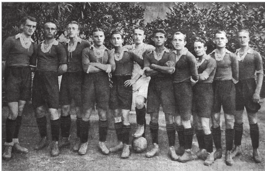
Moštvo SK Ilirije, ki je osvojilo premierno prvenstvo Ljubljanske nogometne podzveze leta 1920 ( Sport , 14. 8. 1920, št. 8, str. 1)