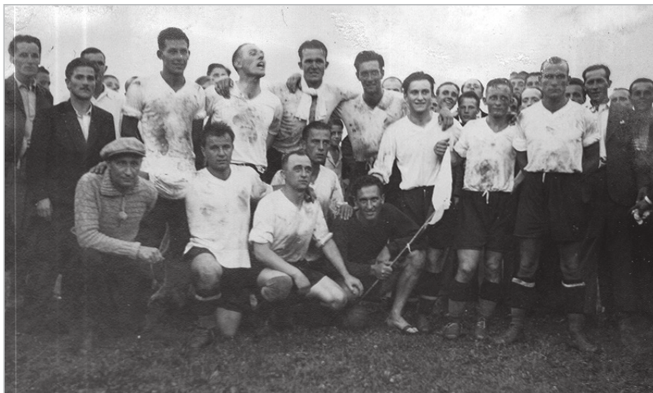
Moštvo AŠK Primorja iz leta 1935, ki je še drugič po letu 1933 uspešno nastopalo v končnici državnega prvenstva kraljevine Jugoslavije in na koncu v konkurenci desetih klubov zasedlo relativno skromno deveto mesto

nastopali v zaključnih bojih za naslov prvaka kraljevine Jugoslavije. 81 Leta 1933 je prišlo do združitve tudi med AŠK Primorjem in ljubljansko SK Svobodo, kar je še dodatno okrepilo že tako izjemno kvaliteten igralski kader črno-belih . 82