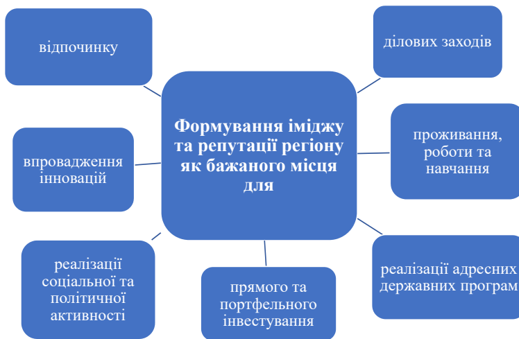
Рис. 1. Завдання брендингу території

Завдання брендингу території відображено на рис. 1.