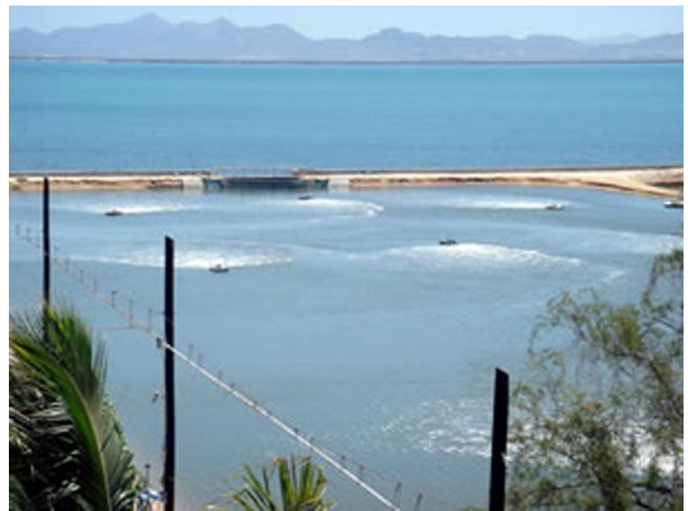
Fig. 2. Estanque de 1 ha con recambio de agua por diferencia del nivel de mareas.