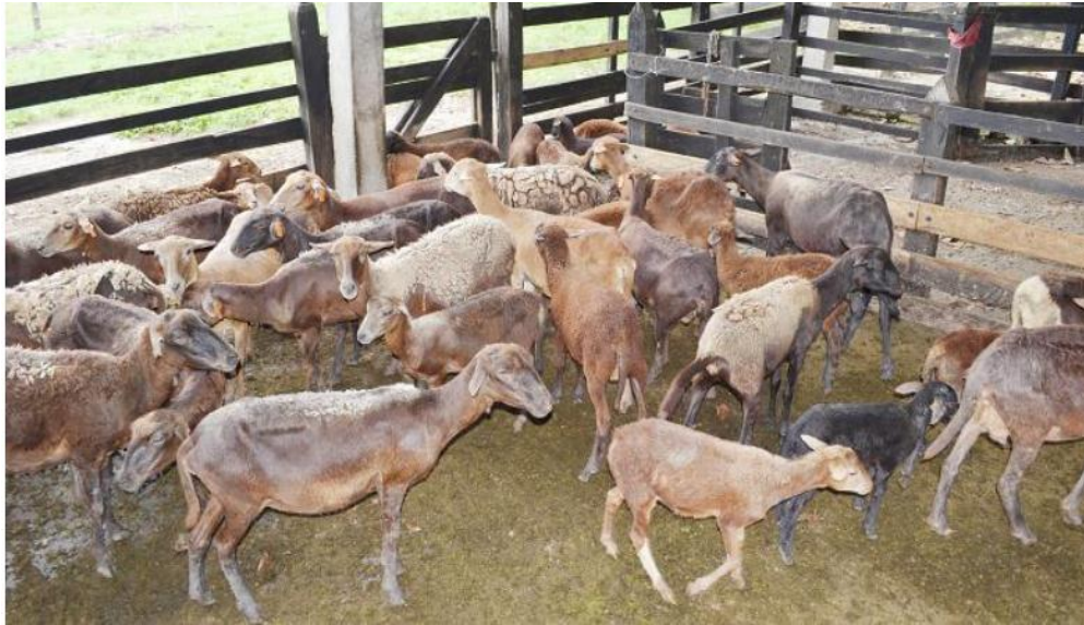
Figura 1. Población de la hembra ovina de pelo criollo (Camura) colombiana