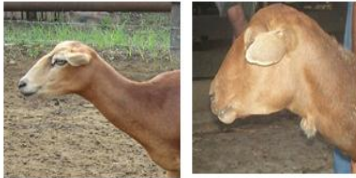
Figura 5. Características morfoestructurales del cuello de la Camura

Toda la población presentó un cuello de aspecto generalmente largo, delgado, fino y poco musculoso (Fig. 5).