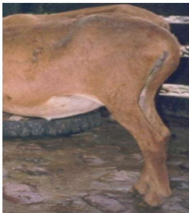
Figura 3. Características morfoestructurales de las extremidades posteriores de la Camura

En la Tabla 2, se observa la frecuencia de algunos caracteres morfológicos de la Camura. La muestra de ovejas evaluadas se caracterizó por mostrar línea dorso-lumbar descendente hacia la grupa, clasificándose como grupa inclinada ( 25-37^\circ ), en este caso, la tuberosidad isquiática (punta de la nalga), desciende levemente, contribuyendo a la inclinación de la grupa (97,4%). Este tipo de anca está determinada por la posición de la cadera, donde la tuberosidad isquiática está por debajo de la línea de la tuberosidad coxal, facilitando el trabajo de parto. El tipo de inclinación presentado en la grupa de las Camura, con presencia de buena longitud en los músculos de la nalga, permite movimientos rápidos en estos animales, sobre todo si forma un triángulo isósceles entre las líneas que unen la tuberosidad coxal (anca), tuberosidad isquiática (punta de la nalga), y rótula (SÁNCHEZ et al. , 2009).