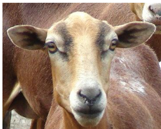
Figura 4. Características morfoestructurales de la cabeza de la Camura

Las orejas en su mayoría son horizontales (99,04%) y un pequeño porcentaje presenta orejas caídas (0,96%); tienden a ser de tamaño pequeño (53,05%) a mediano (46,3%) y solo una pequeña proporción (0,64%) presenta orejas grandes. BRAVO y SEPÚLVEDA (2010) afirmaron que la ubicación de las orejas de forma horizontal y de mediana longitud está correlacionada con el perfil cefálico recto y frente ancha, concordando con las características morfológicas de la Camura encontradas en el presente estudio (Fig. 4).