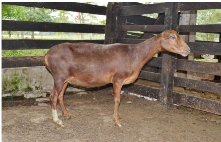
Figura 6. Características morfoestructurales del tronco de la Camura