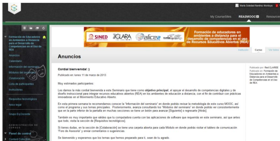
Figura 6. Portal del Seminario de Formación de Educadores en ambientes a distancia para el desarrollo de competencias en el movimiento educativo abierto ( https://www.coursesites.com/webapps/Bb-sites-course-creation-BBLEARN/pages/index.html )

En un diagnóstico que se realizó entre los participantes del proyecto SINED-CLARISE para la educación a distancia, se pueden vislumbrar los retos siguientes: (a) necesidad de generar políticas nacionales e institucionales que regulen y promuevan el acceso abierto en las prácticas educativas; (b) es imperante el desarrollo de sistemas de gestión de REA y la comunicación del conocimiento abierto y, (c) la promoción de una cultura de colaboración académica (que quizá es el reto principal), donde se reconozca la importancia de compartir, se promueva la producción de REA y su uso en las prácticas educativas de la modalidad a distancia (Ramírez, 2013, en evaluación).