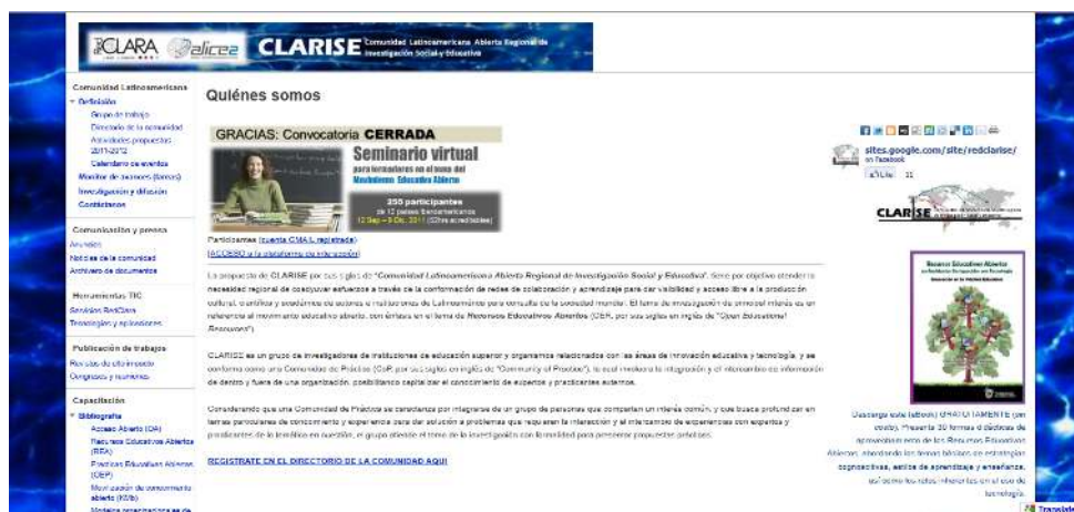
Figura 4. Portal de CLARISE ( https://sites.google.com/site/redclarise/ )

han venido integrando a la red varios participantes de otros países Latinoamericanos, del Caribe y de Europa (ver portal del sitio en Figura 4).