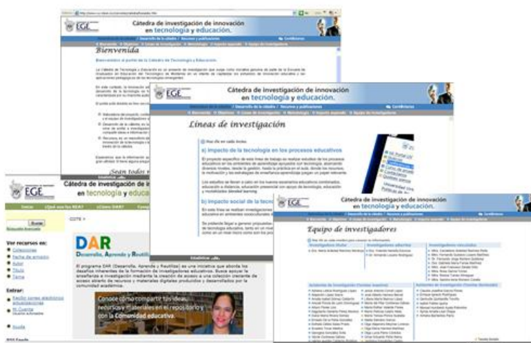
Figura 2. Portal de CIITE ( http://www.ruv.itesm.mx/convenio/catedra )

La característica de este caso es que se parte de una línea de investigación de un profesor titular y se integran otros profesores para formar estudiantes, para trabajar integrados en la temática (simulando un efecto “cascada”), por medio de procesos a distancia.