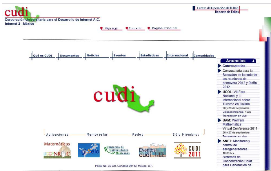
Figura 3. Portal de CUDI ( http://www.cudi.edu.mx/ )

El contexto de este caso se presenta en una red mexicana de investigación educativa: Corporación de Universidades para el Desarrollo de Internet (CUDI http://www.cudi.edu.mx/ ). CUDI fue fundada en 1999 y es una asociación civil sin fines de lucro que gestiona la Red Nacional de Educación e Investigación para promover el desarrollo de nuestro país y aumentar la sinergia entre sus integrantes. En CUDI se busca impulsar el desarrollo de aplicaciones que utilicen la red nacional para fomentar la colaboración en proyectos de investigación y educación entre sus miembros (ver portal del sitio en Figura 3).