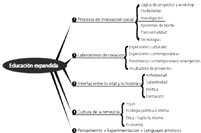
Figura 2. Gráfico de A. F. Díaz sobre educación expandida