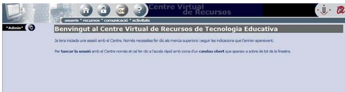
IMAGEN 7. Pantalla principal del actual centro de recursos