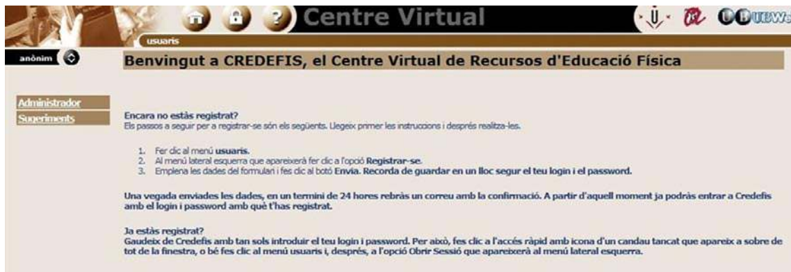
IMAGEN 6. Pantalla principal del entorno CREDEFIS