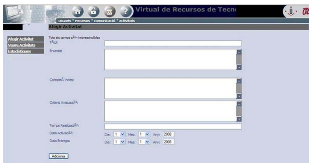
IMAGEN 5. Opciones de actividades del CVR

como consultar las estadísticas de visualización. Esta herramienta no permite el envío de archivos a los alumnos, por lo que, más que una aplicación para el desarrollo de actividades, puede entenderse como un medio de difusión de las actividades que hay que llevar a cabo en el aula.