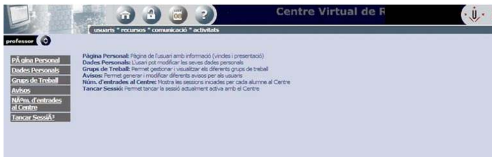
IMAGEN 2. Opciones de usuario del CVR

El primer grupo de herramientas (imagen 2) con las que se puede interactuar en el CVR son las opciones de usuario que permiten rellenar una solicitud de registro del sistema. Esta solicitud debe ser validada por el administrador, dándole derechos de acceso a la herramienta. Una vez registrados, los usuarios pueden editar sus datos personales, así como incorporar su fotografía.