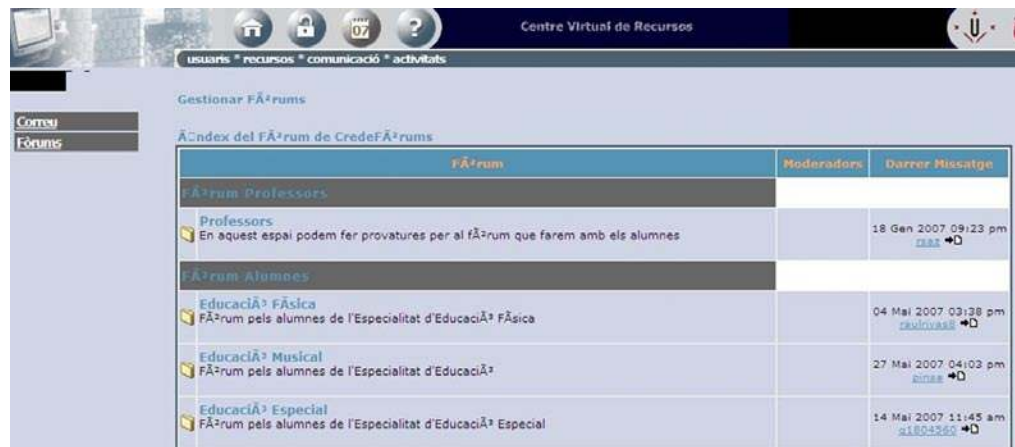
IMAGEN 4. Opciones de comunicación del CVR