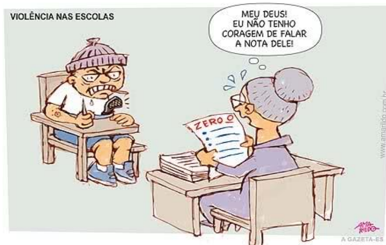
Figura 1 – Charge 1

O quarto módulo foi o mais extenso de todos, durou um mês e necessitou do dobro de aulas planejadas. Com um projetor de imagens trabalhou-se em sala de aula as charges: