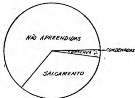
GRÁFICO Nº 2 DESTINO DAS CARCASSAS DOS BOIS PORTADORES DE CISTICERCOSE

e) No que se refere ao destino da carcaça, assunto de interesse fundamental do ponto de vista econômico, temos em andamento uma pesquisa no sentido de se estudar o prejuízo dado à pecuária pela cisticercose. Por ora contentemo-nos em mostrar gráficamente o destino das carcaças: