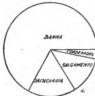
GRÁFICO Nº 4 DESTINO DAS CARCASSAS DOS SUINOS PORTADORES DE CISTICERCOSE

e) Quanto ao destino das carcaças, repete-se aqui o que já afirmamos para os bovinos.