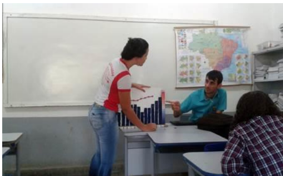
Figura 1. Trabalho em sala com o climograma lúdico.

O instrumento é feito de madeira e revestido por uma peça de metal para que seja possível a colocação das peças imantadas do índice de temperatura e pluviosidade de acordo com os dados de cada clima. As peças são móveis e podem ser colocadas pelo professor ou pelos alunos conforme a necessidade em questão ou a abordagem do tema em sala de aula.