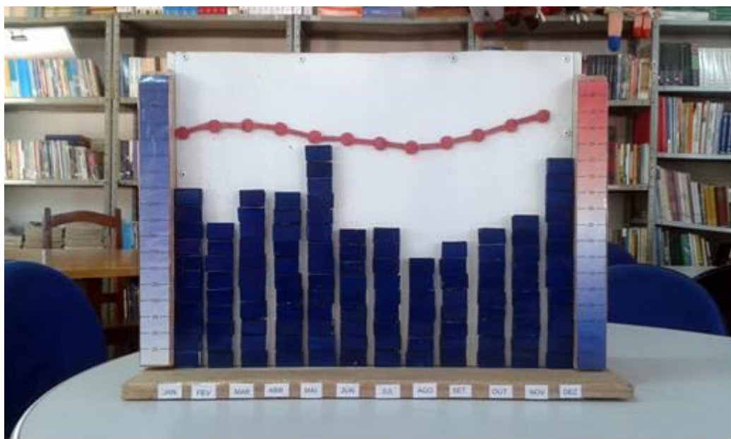
Figura 2. Gráfico demonstrativo do Clima equatorial.

O climograma apresentado possibilita a representação de praticamente todos os climas existentes. As fotos que seguem ilustram algumas representações climáticas e logo abaixo as deduções que se espera que o aluno tenha.