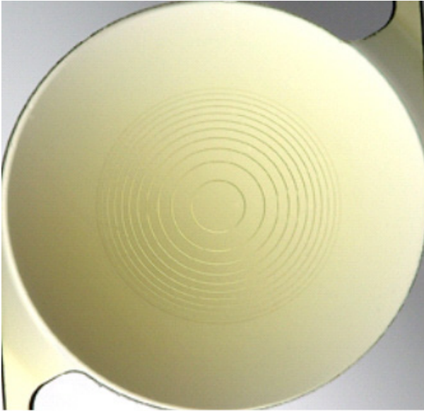
Figure 1. The AcrySof apodized diffractive intraocular lens contains a diffractive structure in the central 3.6 mm on the anterior surface of the optics.